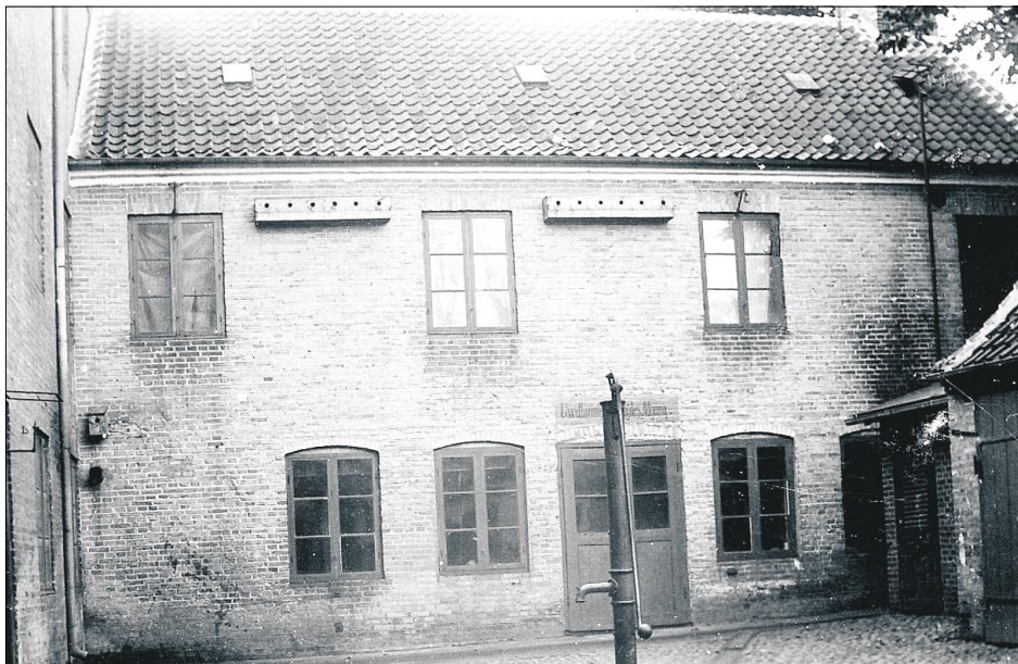
GÅRDEN VED F. C. Bendixsens Tobaksfabrik i Skovgade. Bygningen er i dag revet ned, og grunden anvendes fortrinsvis til parkeringsplads.

■ Rubrikken "Historien i billedet" optræder jævnligt i Thisted Dagblad i håbet om, at det øger billedbidragene til Lokalhistorisk Arkiv.