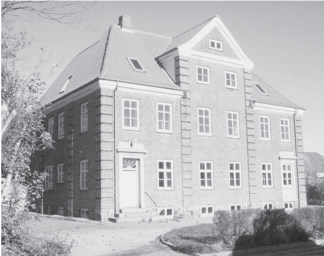
Hurup Politistation 2009

Til disse baller mødte de unge mennesker så op, behørigt medbringende en hel flaske brændevin, som de stillede ved et træ og drak i løbet af aftenen, hvilket medførte, at de pågældende ofte blev snydefulde og forvoldte ballade. Jeg havde besvær med at overbevise befolkningen om, at det var langt bedre at disse unge mennesker sad ved et bord i en restaurant med dug på bordet, og priserne på spiritus bestemte hvor meget den unge kunne og ville drikke.