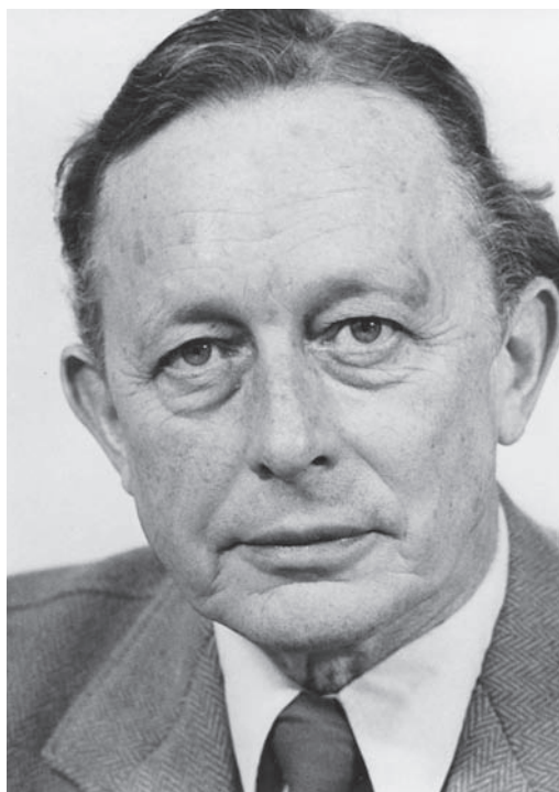
Forfatteren Kay Bagger

Disse personer var derfor særdeles betydningsfulde, idet de egentlig kun var bundet af grundlovens bud om, at enhver anholdt inden 24 timer skal stilles for en dommer, der så praktisk talt kunne holde en sigtet person fængslet i ubegrænset tid, hvilket dog skete yderst sjæl-