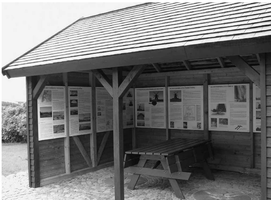
Udstillingshuset ved Klostermøllen i Vestervig.

en ”kommer i land” på Agger Tange, og forløber i Sydthy gennem Agger, over Lodbjerg til Lyngby og videre nordpå over Stenbjerg, Vorupør, Klitmøller, Hanstholm, Vigsø, Lild Strand, for at forsvinde i mod øst ved Bulbjerg. Mere end 80 lokaliteter og emner er grundigt beskrevet og illustreret med fotos.