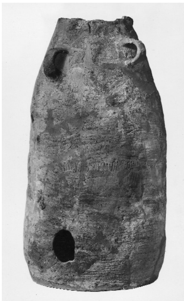
Fig. 5. Den over 1 meter høje kornsilo fra jernalderhuset.

At man i dag kalder jernalderboplads med op til 2 m tykke kulturlag for byhøje, skyldes ligeledes Hans Kjær, som i sit London foredrag