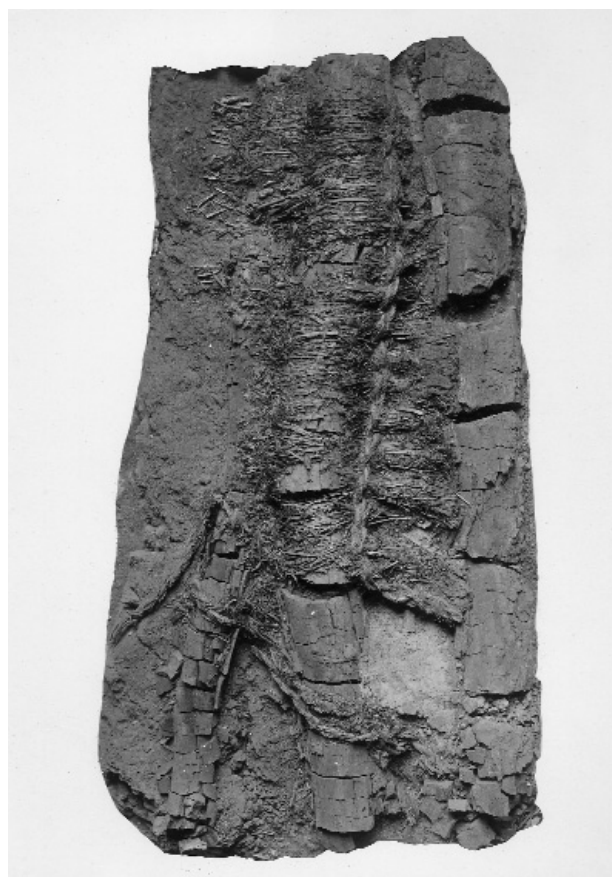
Fig. 6. Næsten 2000 år gamle forkullede rafter med tæppe af strå og græs sammenholdt med en syning af snoede halmsimer fra det første jernalderhus.

I dag godt 70 år efter afslutningen af Nationalmuseets gravninger ved Ginnerup fascinerer og fængsler fundene fra dengang endnu med deres mange detaljer om dagliglivet i jernalde-