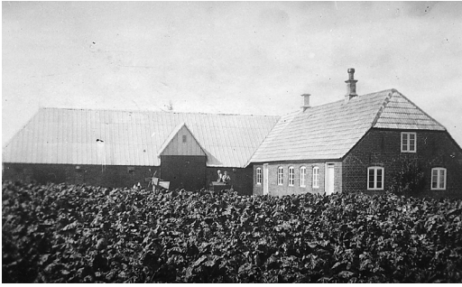
Den gamle ejendom nedrevet i 1955.

1920-erne. ( Det var her man mødtes for at få de sidste nyheder, idet det langt fra var alle der læste aviser dengang). Når de kom hjem havde moderen altid middagsmaden parat og man samledes om bordet, og det første der spurgtes om: hvad nyt der var sket i ugens løb?