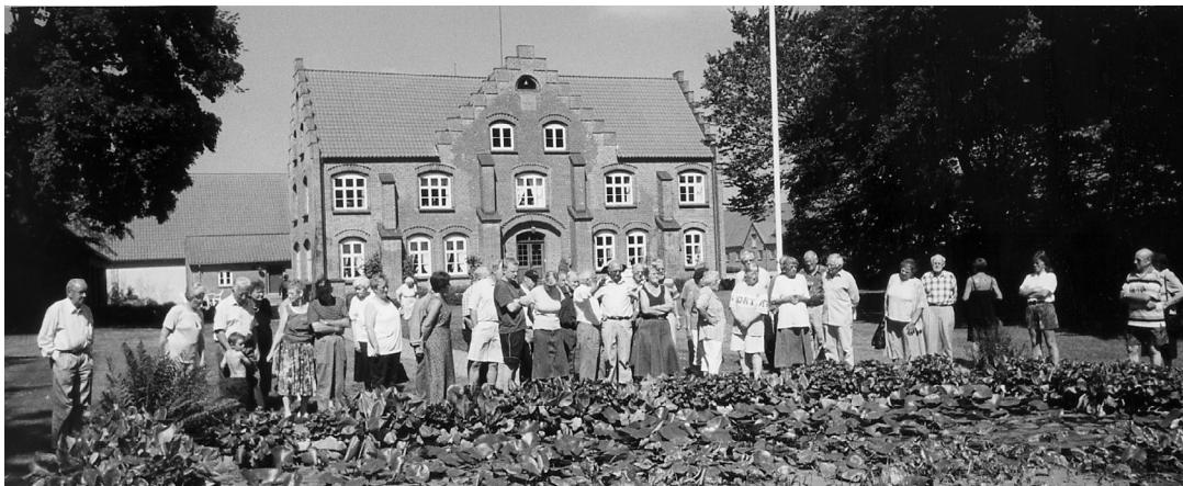
Havevandring på Rosvang.

Jeg vil heller ikke fortælle om, hvad vi så og hørte på Færgesborg eller Egebaksande. Det skulle jo nødig gå sådan, så folk bliver hjemme fra næste års udflugt, fordi de bare tænker: Lad os nu blive hjemme. Det er meget lettere at læse om udflugten, når årbogen udkommer!