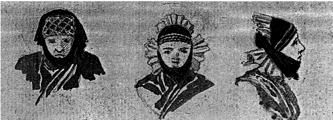
I 1830 tegnede Martinus Rørbye på en rejse i Thy en række studier af bondebefolkningen, deriblandt mange kvinder med munkklæde. Skitsebog 1830. Kobberstiksamlingen.