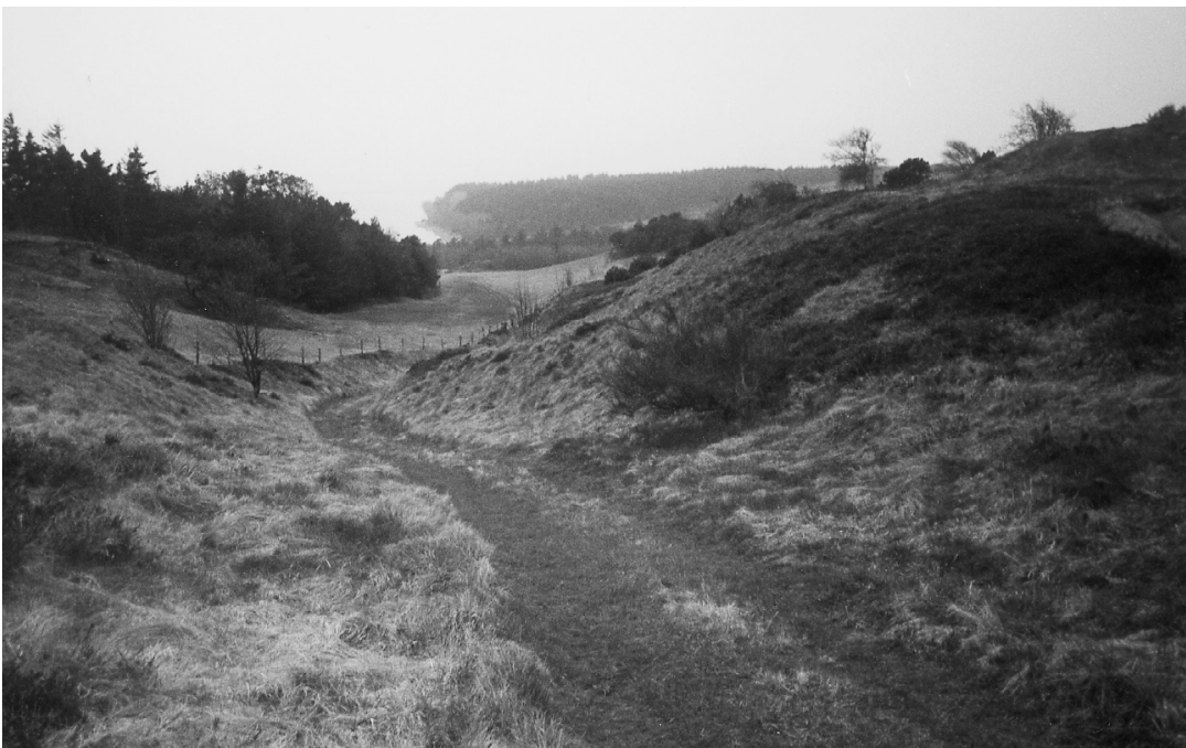
Foto af Kløvenhøj og oldtidsvejen ved Kløvenhøj, som omtales i »Ravvejen« af Mads Lidegaard. Kløvenhøj er fra ældre bronzealder, hvilket vil sige, at den er fra 3000 til 3800 år gammel. Som noget forholdsvis nyt har man opdaget, at en oldtidsvej undertiden forsvinder ind under en høj. Det vil sige, at højen kan være anlagt ovenpå en vej, og så er vejen altså ældre end højen.