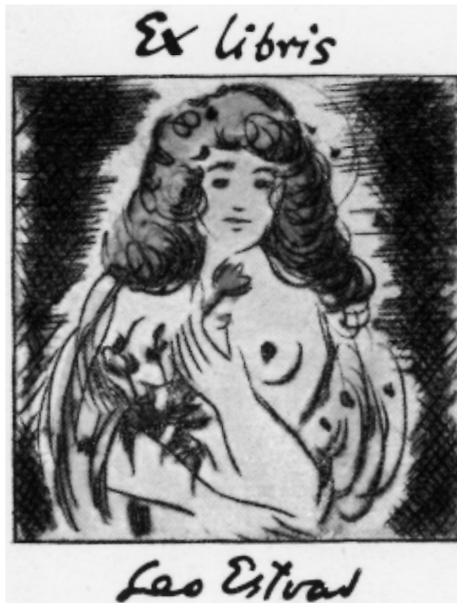
Estvads eget bogejermærke. Kvinden med blomster symboliserer livets skønne sider.

Og Thy og navnlig egnen omkring Lodbjerg