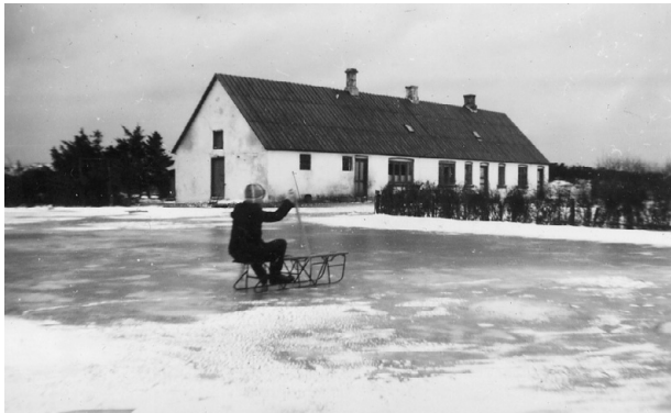
Oversvømmelse. Der kælkes mellem husene.

ofte havde været vejviser for ham, når han gik på jagt. Det ville jeg ikke, uden at jeg fik spannden med fisk med så de andre ikke skulle bære den hjem, og det fik jeg lov til.