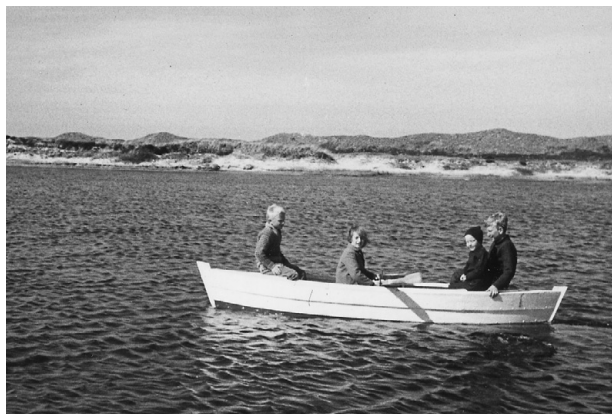
Glade sommerdage ved Besolevandet.