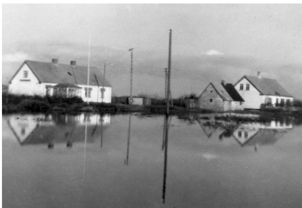
Oversvømmelse om foråret.

I engen kunne det ske, at vi fangede en lille ål, og det føltes som om man havde vundet i lotteriet.