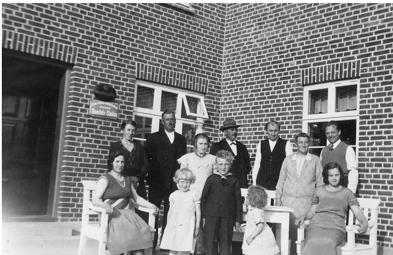
Gæster ved min barnedåb, søndag den 15. august 1933.