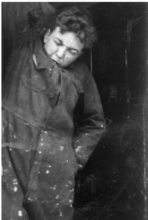
Min bror bilder sig ind, at der er faldet et tusindben ned på ryggen af ham, eller også har han fået lus.

begyndte radiomanden at snakke igen. Engang jeg var alene og ikke kunne få liv i fyren, prøvede jeg med en fiskefrikadelle, men den kunne han åbenbart ikke lide, for han mælede ikke et ord. Det gjorde til gengæld min far, da dellen begyndte at stinke efter nogle dages forløb og fandt den inde mellem radiolamperne.