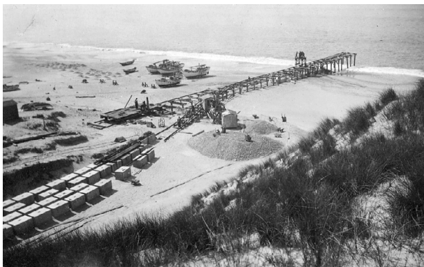
Molen bygges 1936.

Det kristelige er måske endda det, der står mindst klart for de mennesker, der medvirker ved dåben eller andægtig ser den ske. Ikke alle, der lader deres børn døbe føler sig hjemme i