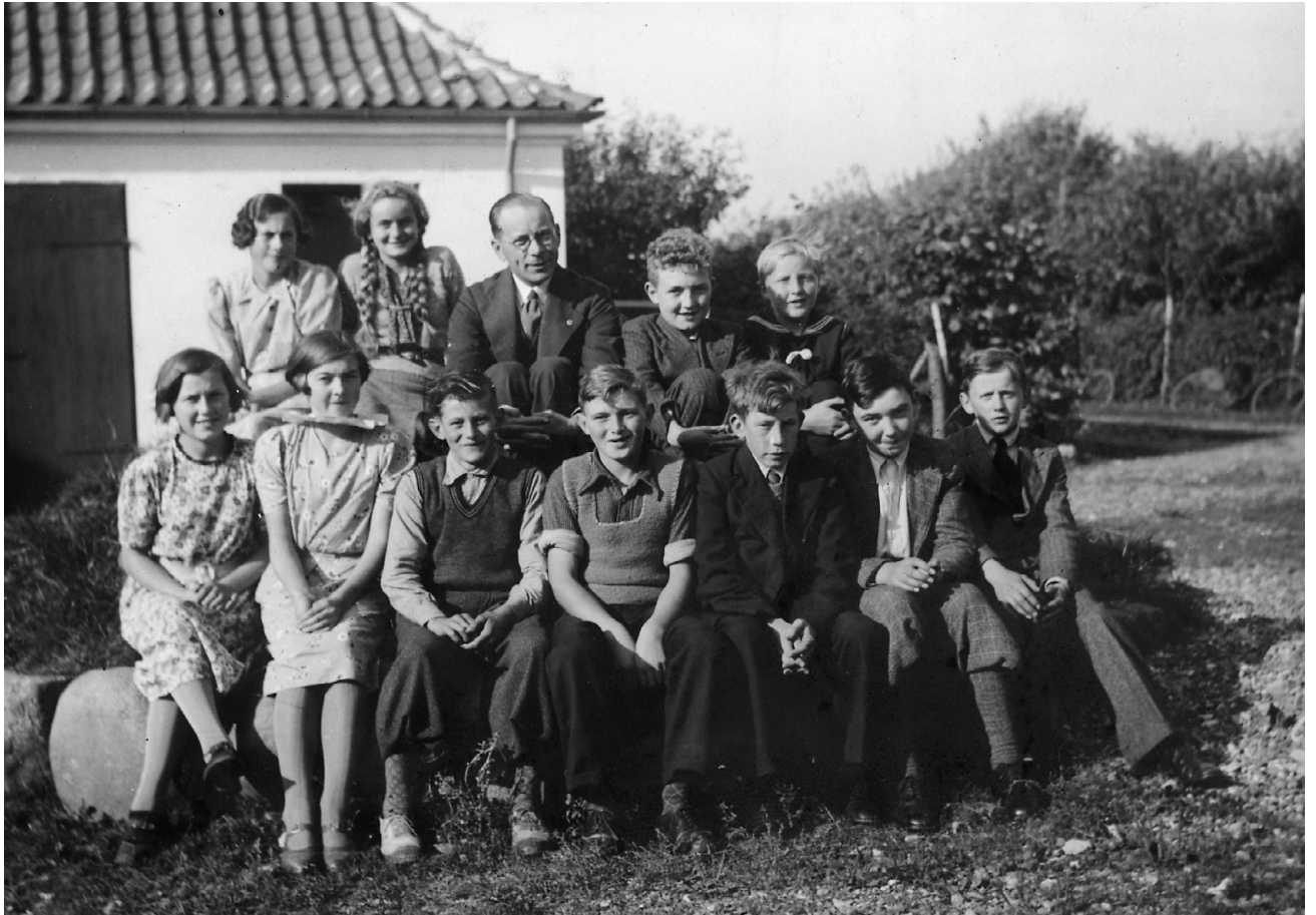
Konfirmandholdet i Svankjær 1938: