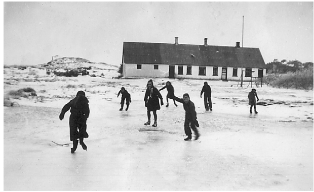
Isvinter - vi løber på sk øjter ind mellem husene.