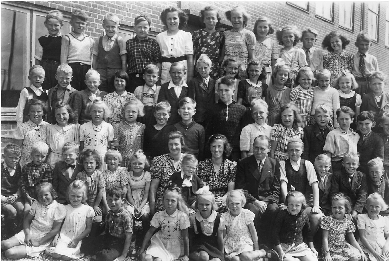
Eleverne i Svankjær Skole 1945: