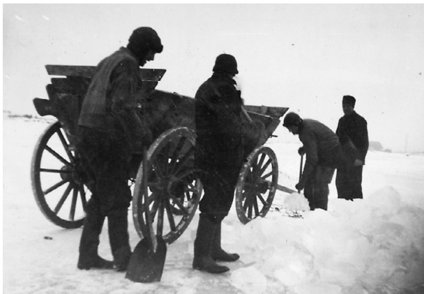
Der bjerges is til iskældrene i fiskehuset.