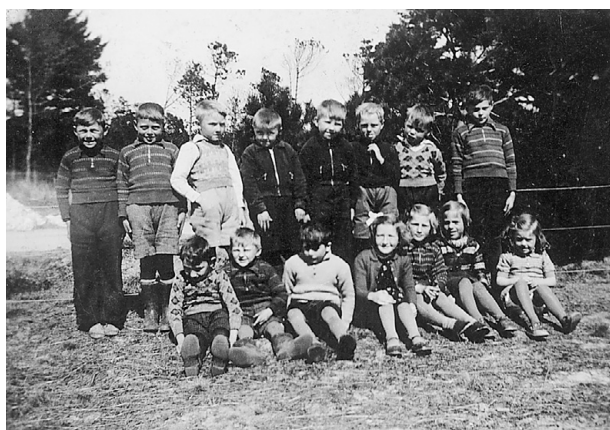
Æ bette klaes 1941.