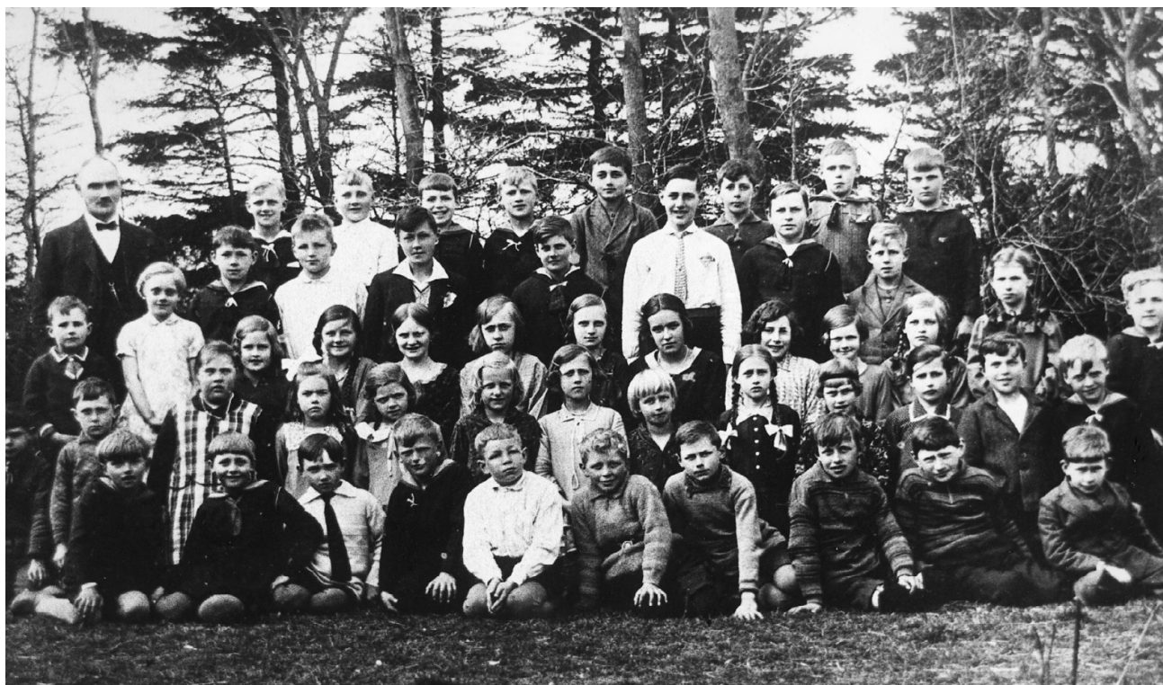
Elever i Svankjær gl. Skole 1931.