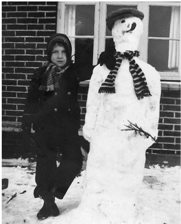
Min snemand. Den mærkelige fodstilling skyldes, at sådan satte soldaterne deres fødder på de gamle billeder.