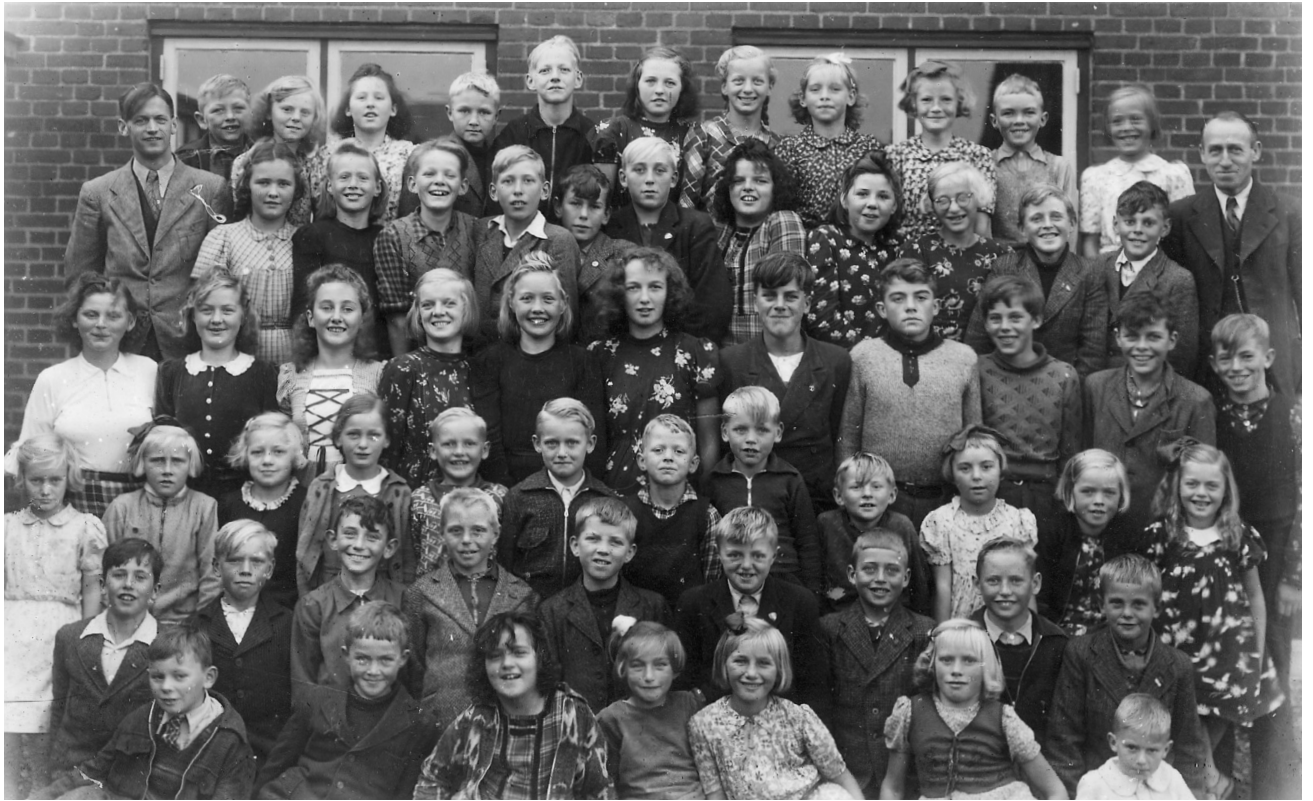
Eleverne i Svankjær Skole 1943.