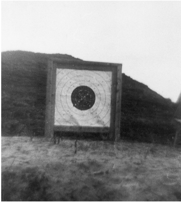
Skydeskiven i Lyngby ca. 1940.

mange gode skytter imellem medlemmerne. Der var dog også nogle, som bestemt var det modsatte, men det gjorde ingenting, det var jo mest samværet det gjaldt. Der var særlig en skytte, som vi unger glædede os til at se skulle skyde, da han for det meste ramte jordvolden foran markørgraven, så støv og sand sprøjtede op som røg fra en ildebrand, og markørerne vinkede lynhurtigt »forbi« uden at undersøge skiven, de vidste, at nu kom der flere af den slags træffere, og selv om nogle skud ramte skiven, vinkede de grinende, hostende og harkende »forbi« Skytten kunne ikke forstå det, han mente, at der var fejl ved geværet. Men det var jo nok hans øjne, der ikke længere var så skarpt seende som i hans unge dage.