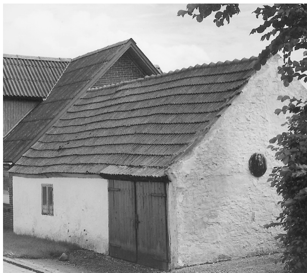
Mors fødehjem - hus og stald.

Altså. De længtes, de frøs og de var sultne.