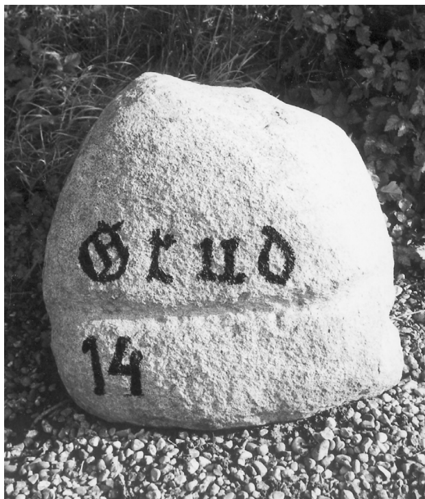
Stenen står ved Grud Gård.

underlagt Rigsarkivet - ved jeg, at »Forstærkningen« betyder reserven.