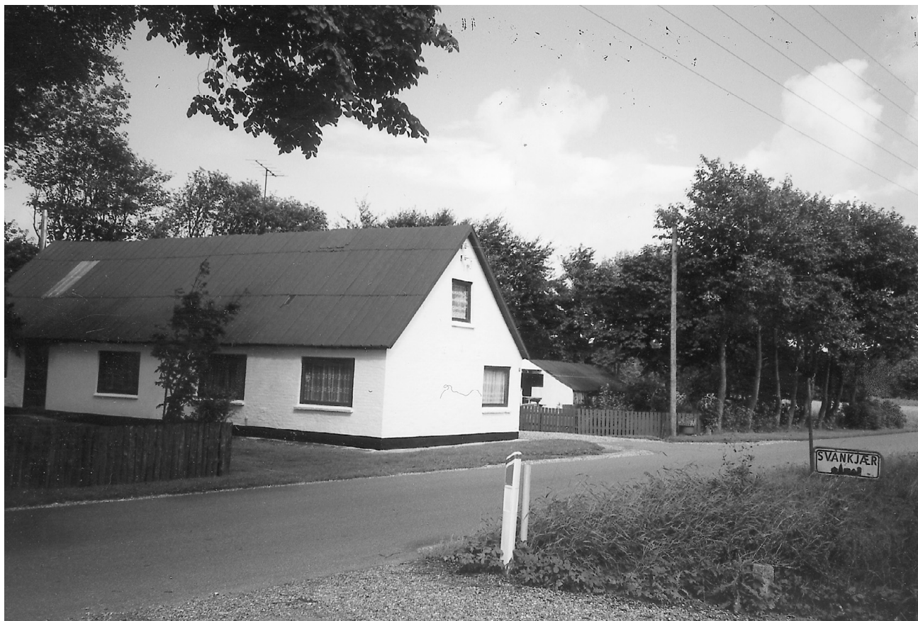
Min oldefars hus i udkanten af Svankjær by.