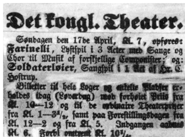
Dagen efter faldt Dybbøl.

For en god ordens skyld skal jeg her lige gøre