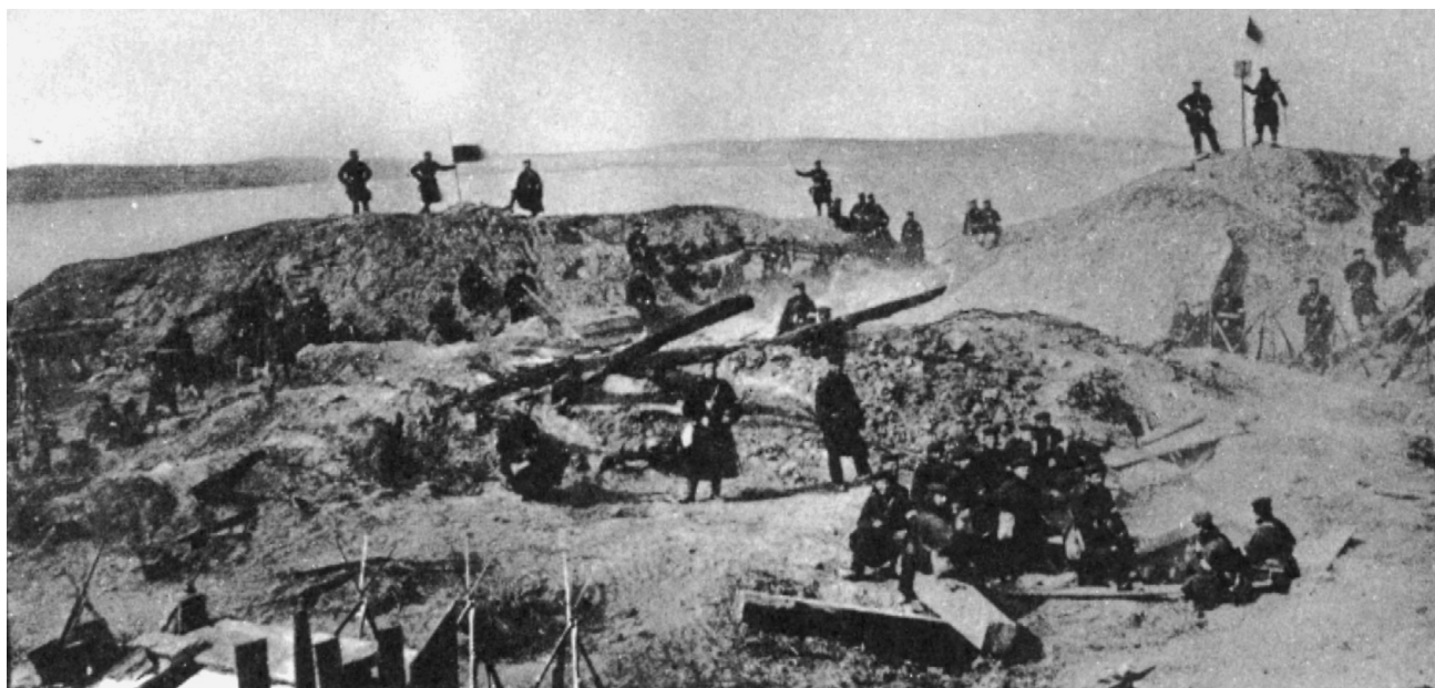
Sejrherrerne fotograferet på skanse II.

Ved forordning af 13. juni 1771 ( Struensee-perioden ) ophævedes straffen helt. Den 27. februar 1772 indførtes den på ny. Ved forordning af 23. maj 1800 § 3 begrænsedes den til kun at bestå i lave lejermåls bøder.