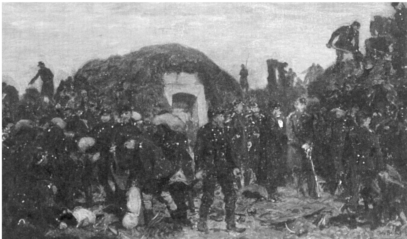
Christian 9. aflagde et natligt besøg i skanserne på Dybbøl kort før den famøse storm.