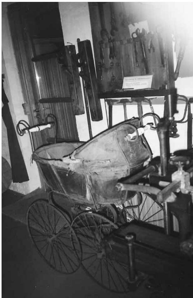
Barnevogn fra ca. 1870.

fra det nu nedlagte Hvidbjerg sygehus . Man ser gamle husholdningsredskaber. Blytækkerens værktøjer. Snedkerens oprindelige værksted og Frisørens salon. Bogtrykkerens gamle maskiner. Osv. osv.