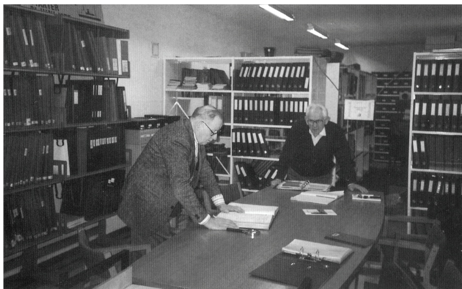
Sydthy Egnshistoriske Arkiv.