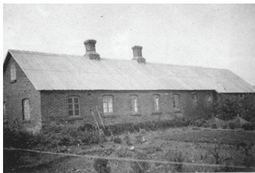
Det lille hus set fra nordsiden i 1929.