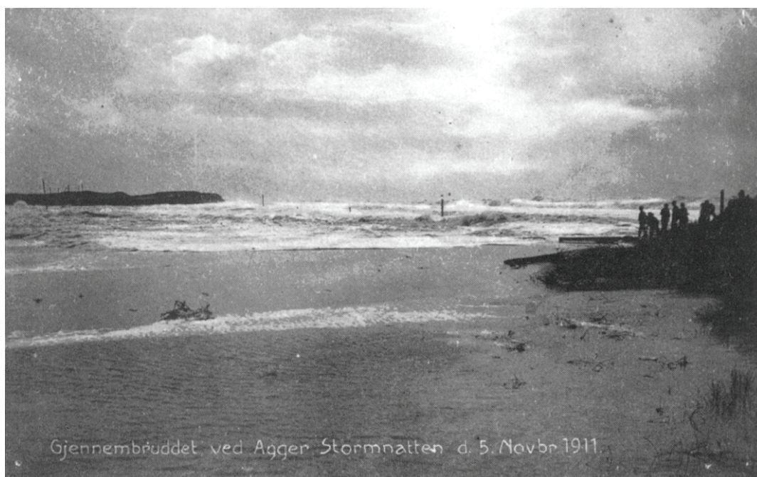
Gjennembrudet ved Agger - stormnatten den 5. november 1911.

Adskillige stormfloder har i 15 - 1800 tallet overskyldet og udslettet mange små landsbyer samt ændret landkortets udseende.