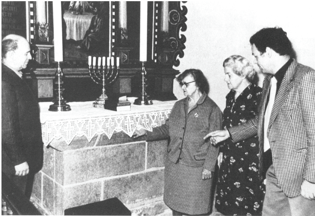
Her beundres den nye alterdug syet af Fr. Pedersen.

som vi synger med Grundtvig. For de fleste et liv med både glæder og sorger. Nogle nåede mere her i livet end andre, men uanset hvad de nåede er ét sikkert, nu er de ens.