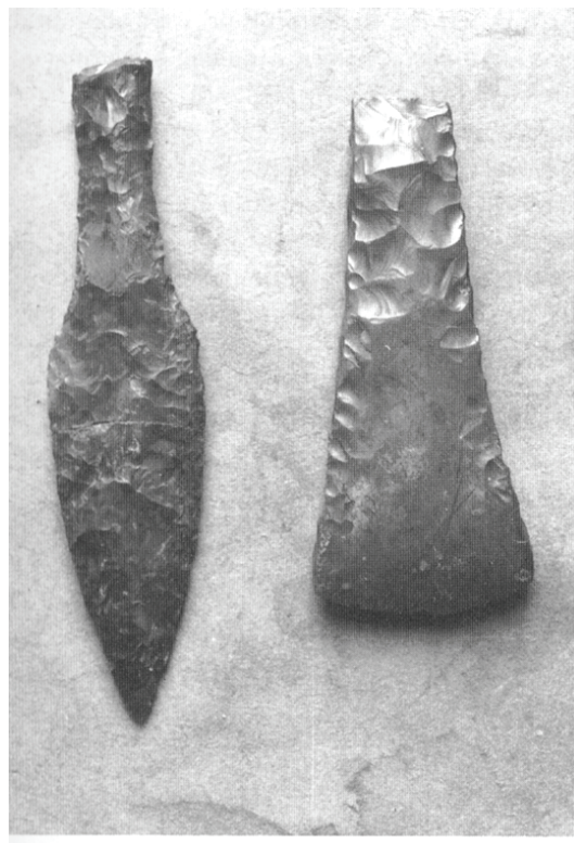
Dolk og økse.

Jeg er blevet opfordret til at fortælle lidt om den samling af flinteredskaber fra stenalderen, som jeg har fundet igennem et langt liv.