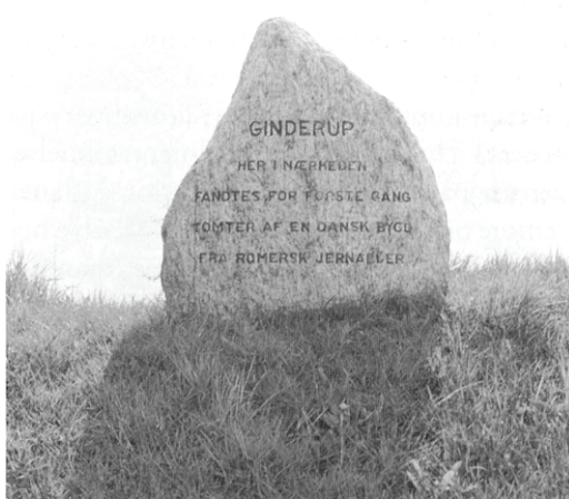
Mindestenen ved Ginnerup.

Dette år har budt på mange jubilæer for store begivenheder i vort lands historie. Men også mindre og mere lokale ”fødselsdage” har fundet sted. Således er det 50 år siden at Ginnerupstenen blev rejst.