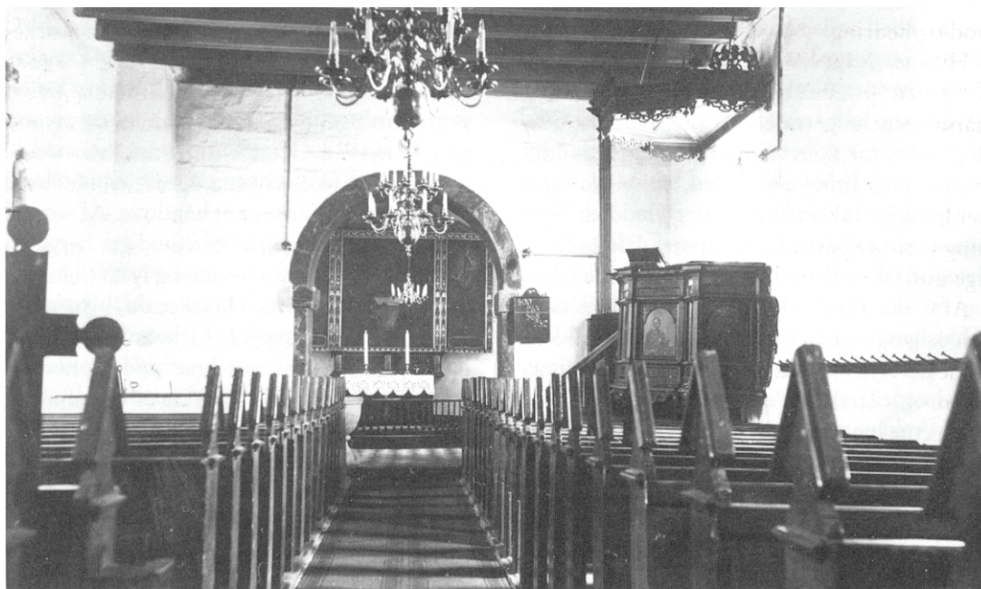
Ydby Kirke før restaureringen 1928

liv, for når det blev så trist, som det tog sig ud for de gamle omkring mig, måtte fristelserne være få, små og overvindelige. I mellemtiden måtte jeg til glæde for det nærværende galleri, spille efter falske noder, for det stod klart, at Gud ikke lod sig narre. Som årene går, bliver de fleste vel både mere tænksomme og mere triste. Sådan er det gået mig, den side af sagen er klaret, så nu er der kun tilbage at overvinde fristelserne og gøre bod og bedring.