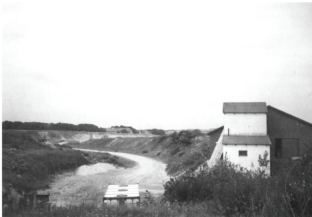
Ydby Mørtelværk med Trapgården og lidt af stationsbygningen i baggrunden