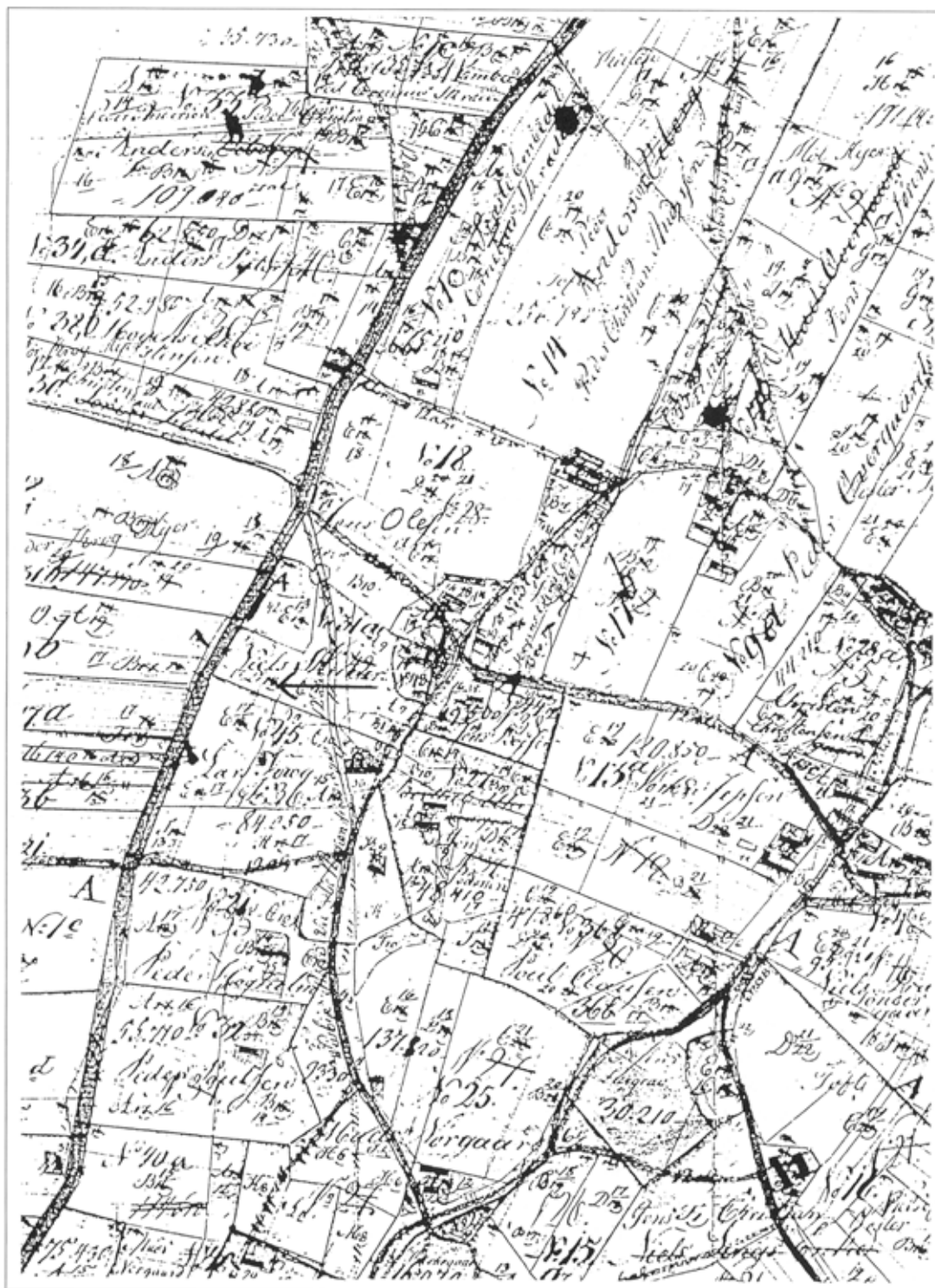
Udskiftningskort fra Heltborg 1793. Pilen viser fællesbrønden placering