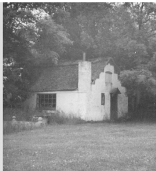
»Rødhætte« der ligger på tomten af Miebernes gamle beboelse, har bl.a. været brugt som vaskehus, grisesti og smedie for Koltzer.

udgyde sine uforskammetheder overfor mennesker med handicap, da de er tilbøjelige til at tro, at de nok hørte forkert.