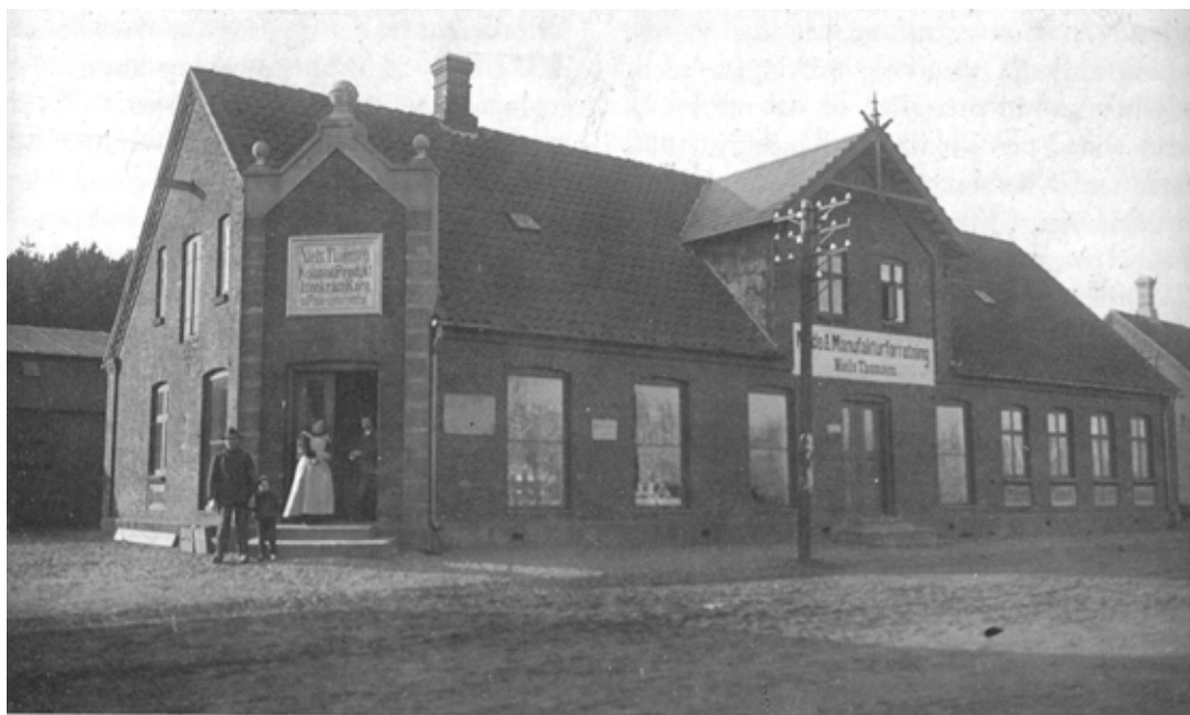
M. J. Larsens forretning - senere Niels Thomsens