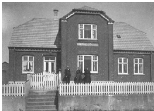
Gl. præstebolig, det nuværende bibliotek, i Tvolm, Ydby Sogn ca. 1918