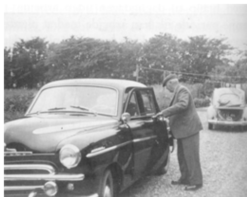
Min bedstefar ved den sorte Wauxhall som var hans stolthed.

Med tiden voksede hans firma, så der blev ansat nogle folk. Det første tilbud, der skulle gives i konkurrence med andre ingeniørfirmaer,