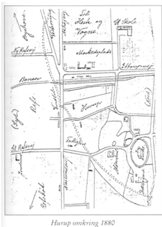
Hurup omkring 1880