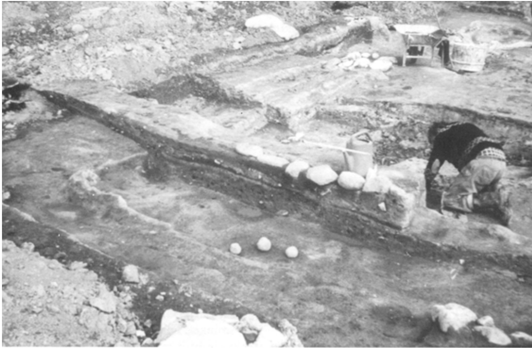
Undersøgelse af Jernalder-bebyggelse under den nye skole i Hurup