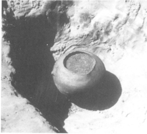
Urnebegravelse fra Keltisk jernalder. Urnen indeholder brændte menneskeknogler

anseelige Kløvenhøj. Fra denne høj er der en storslået udsigt over Skibsted Fjord og over store dele af egnen i øvrigt.