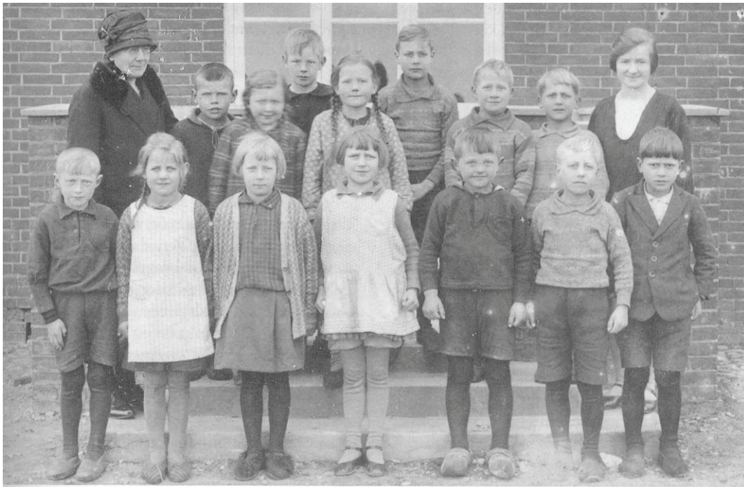
Skolebørn i Sdr. Ydby Forskole 1929.