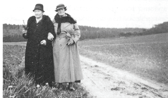
Kammersgårdsvej ud for bedstemors hus