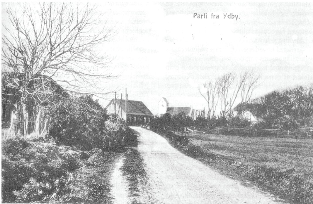
Bakkegårdsvej, huset nedrevet ca. 1910