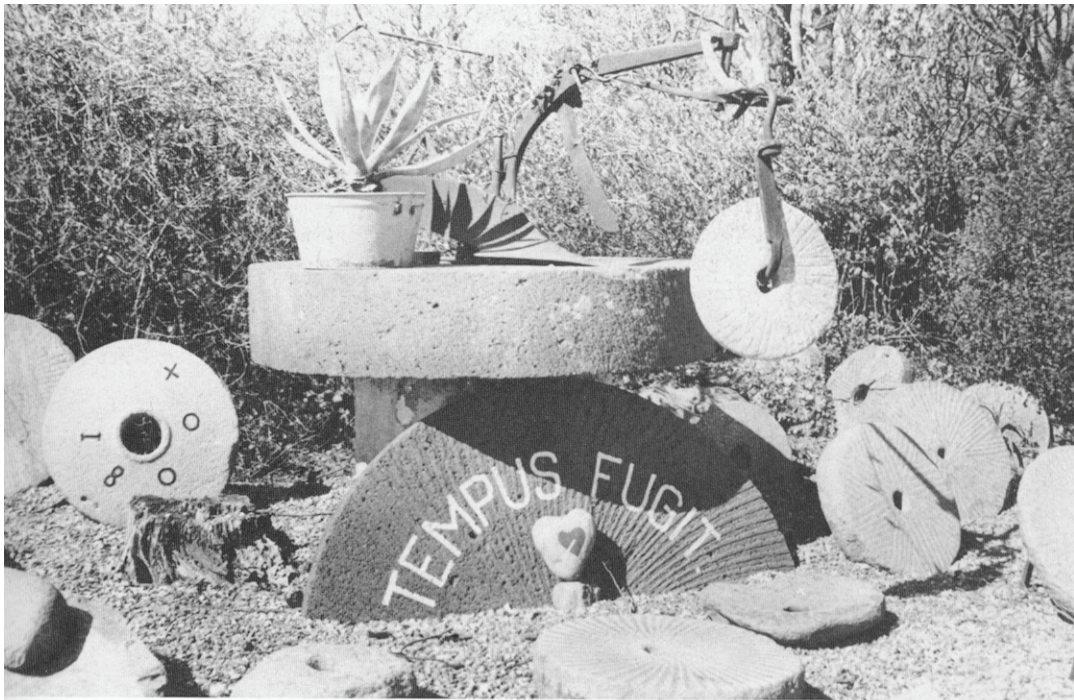
»Tiden iler«