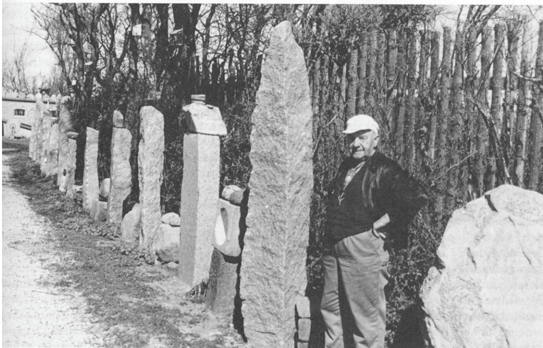
Alléen med klyvesten.

stamme fra Kirstens hjem, da der fandtes nogle af sådanne ting i andre skifter derfra.