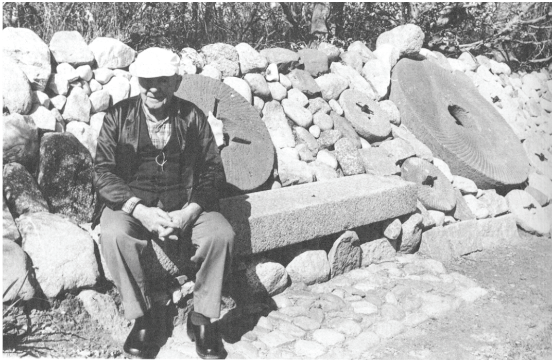
Et lille tiltrængt hvil ved møllestenene.

matriklen af 1664 opføres, som hørende under A. B. B.s arvinger til Ørum. I matriklen 1688 hører gården fortsat under Ørum. Senere hører den under Poul Klingenberg's gods, der har overtaget den ved skøde den 16. maj 1685. Da Mads Sørensen Tølbøll fik fæste brev på Skyumgård, var det udstedt på Tandrup. I sidste halvdel af 1700 tallet blev Skyumgård solgt til Irup, hvorfra den igen blev solgt til selveje til Søren Madsen Tølbøll.