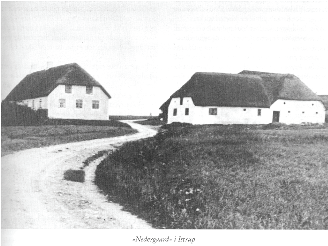
»Nedergaard« i Istrup

Når der var is på søen, var vores karl ude at stange ål, vi havde en karl både sommer og vinter, og de, der var gode til at stange ål, holdt især øje med, hvor der var ”kywl”, dvs. små luftbobler ved ålens for- og bagende. Der skulle helst være klar is uden sne på. Mange håndværkere, især murere, havde ikke arbejde om vinteren og kunne derfor bjerge ”mad” til husbehov ved at stange ål på isen. Det var før søens vandstand blev sænket i 1931.