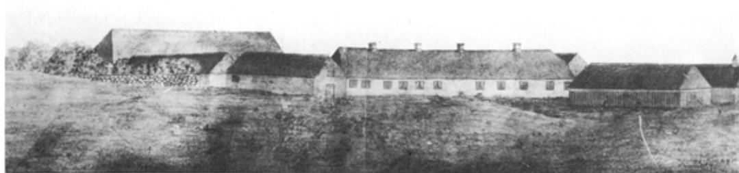
»Bubbels, før branden i 1888