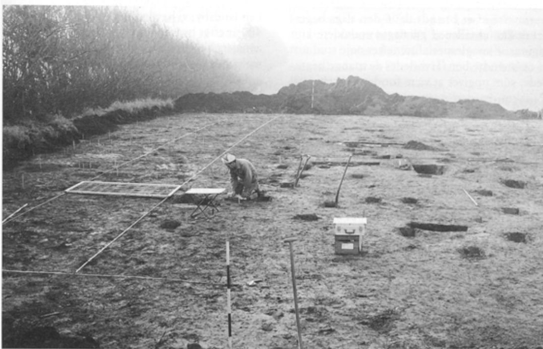
Fig. 3: Ved udgravningen blev mulden rømmet af store partier af marken. Udgravningsmedhjælperen, Kristian Nielsen, Bedsted, er ved at snitte stolpehuller, så man kan se, hvor dybt de er blevet nedgravet i oldtiden. Dette giver oplysninger om husenes konstruktion.

har kontakt med metalgenstande som f.eks. bronze. Under nedbrydningen af metallet udskilles nemlig metalsalte, som virker konserverende på træ, tøj etc.