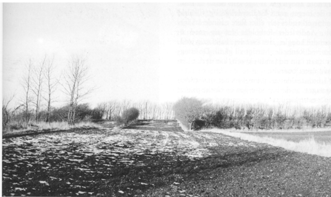
Fig. 2: Bronzealderlandskabsbyen har ligget på den lave bakke i baggrunden.