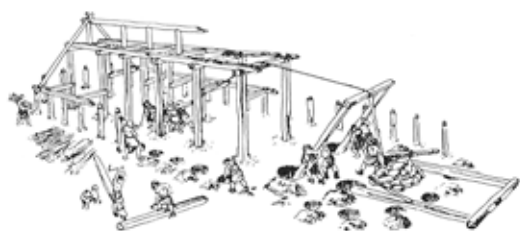
Fig. 4: Bronzealderhus under opførelse Tegning: Flemming Bau. Efter Sesams Danmarkshistorie

Gulve og ildsteder i bronzealderhusene var desværre for længst pløjet væk, og det eneste, som var tilbage, når muldlaget blev fjernet (fig. 3), var et virvar af nedgravninger synlig i undergrundens gule sand. Kun ud fra mønstret i stolpehullerne kan vi i dag rekonstruere husene. De var store, solidt byggede og sædvanligvis orienterede øst-vest, så man bedst kunne udnytte solvarmen og samtidig have gavlen op mod den sikkert også dengang fremherskende vestenvind. Taget blev båret af to rækker kraftige stolper (fig. 4), så husets grundplan blev treskibet. Væggene bestod af mindre stolper, antagelig med fletværk og lerklining imellem. Gavilhjørnerne var afrundede, og midt på hver langside fandtes indgangene, der var trukket lidt ind i huset. Ved placeringen af indgangene deltes huset op i to halvdele, hvor den vestlige blev anvendt til beboelse og den østlige halvdel til stald og lade. Denne inddeling møder vi også i de lidt yngre huse fra den ældre del af jernalderen.