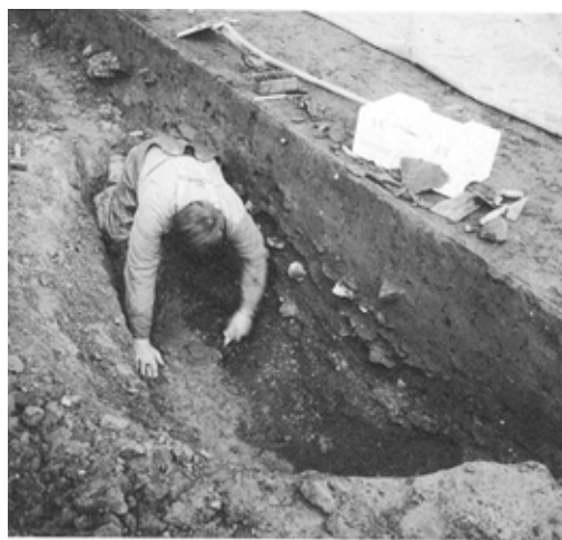
Fig. 6: Udgravning af en større lertagningsgrube.

Hus A har været 7 m bredt og 18 m langt med indgangene helt efter "forskrifterne" anbragt midt for begge langsider. Hus B er lidt mindre med en bredde på 6 m og en længde på 16,5 m. Hvorledes indgangene har været placeret, kan der ikke siges noget om.