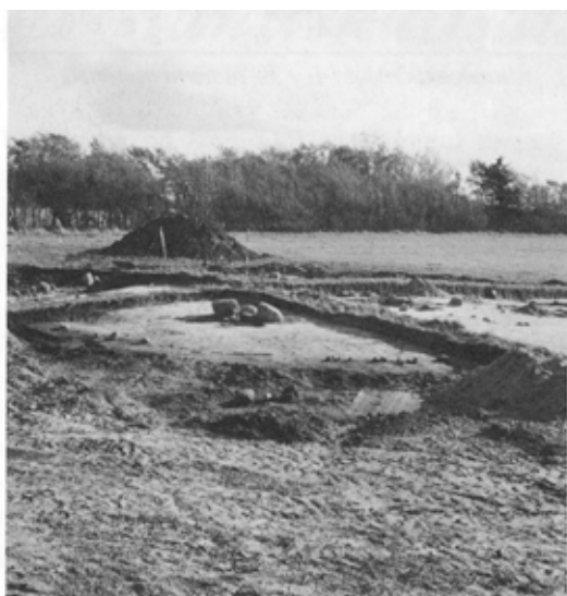
Fig. 1: Gravhøjen under udgravning. De store sten i midten stammer muligvis fra en bronzealdergrav fundet engang mellem 1915 og 1918.

Langt de fleste af museets udgravninger falder ind under museumslovens § 26 - undersøgelser af fund, der enten vil blive eller er ved at blive ødelagt af dyrkning, anlægsarbejde eller lign. I mange tilfælde er udgravningen foranlediget af en lokalplan, som fortæller, at et område planlægges bebygget. Således også ved Bedsted, hvor lokalplan nr. 41 fra Sydthy kommune bebudede udstykning til boligformål af et område mellem Vestervigvej og Rønhede plantage i den sydlige udkant af Bedsted. Villavejen Rønheden fører i dag ind til området. Museets udgravninger førte til undersøgelsen af en overpløjet gravhøj og derefter til afdækningen af en større del af en boplads fra yngre bronzealder, ca. 600-700 f.Kr.