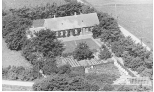
Gammelby skole fra omkr. 1930.