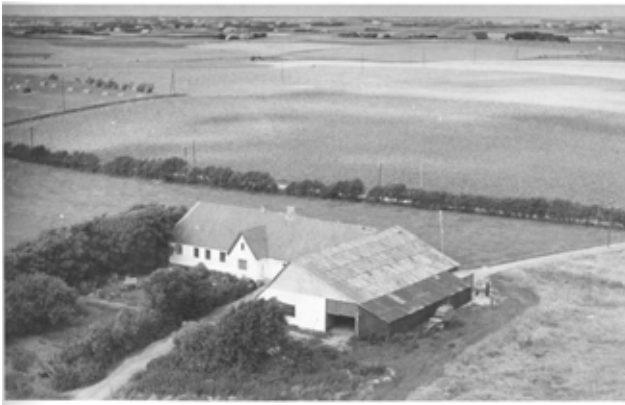
Grurup skole 1846 - 1900, fotograferet i 1930'erne. Vejen på tværs i billedet går fra Grurup kirke (tv.) til den sidste skole i sognet (th.). I baggrunden Bealsted. - Bygningerne brændte i 1961.