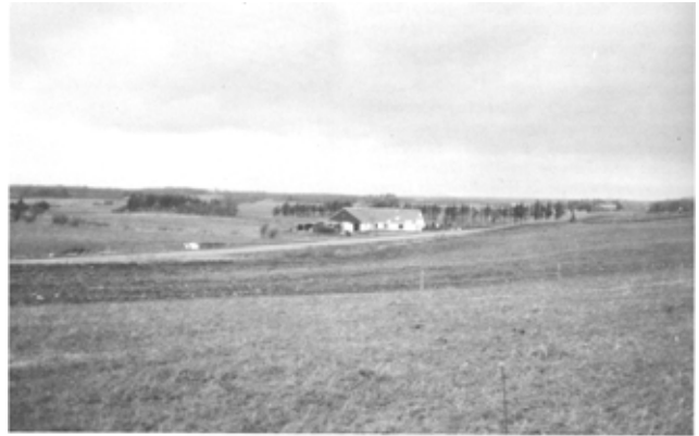
Grurup skole 1836 - 46, her set fra Grurup kirkegårdsmur. - Bygningen ligger på Grurupvej 9.