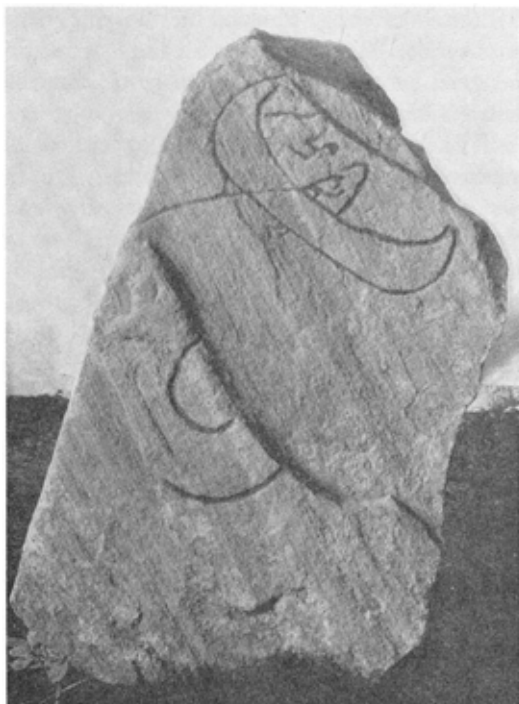
I forbindelse med opførelsen af det nye tårn ved Hørdum kirke i 1955 fandt man en førkristen billedsten med fremstilling af den kendte myte om Thors fiskeri efter Midgårdsormen.

Vestervig kirke er et godt eksempel på sådan en byhøj - alle kan se det, fordi landevejen er skåret igennem.