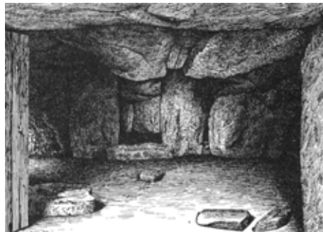
Jettestuen i Lundeboj

gade eller lavede en rist i sildebensmønster ved en indgang, at de ikke skulle slæbe for meget pløje ind i huset. Skikken med brolægning af kantsatte strandsten i sildebensmønster har levet på egnen til vor tid, idet jeg har set den i en stald ude nær Svankjær.