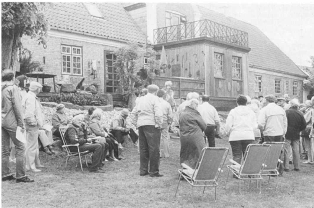
Lyngholm - fra aftenuren 16. juni 1987.