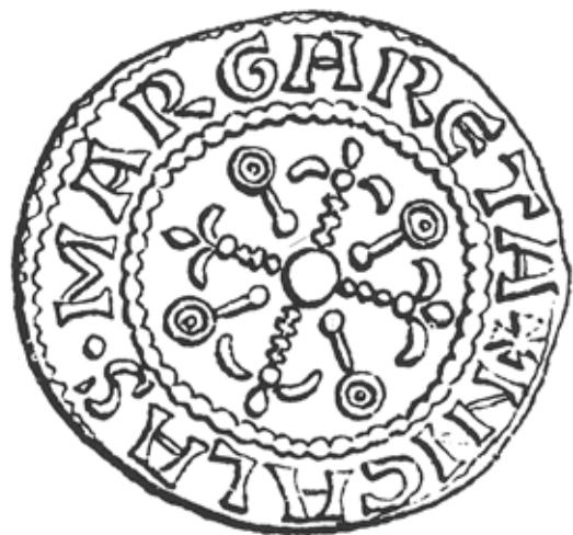
Margrete og Niels, en konges og en dronnings navn på samme mønt, præget i Lund.

Margrete har udfyldt sin rolle som dronning med et stærkt, personligt initiativ, der var ualmindeligt i tiden, der noterer sig hendes kraftigt styrede hånd i kong Nielses regering af Danmark. Hun er iøvrigt den første kvinde der figurerer i et dansk diplom, og den første og eneste i ældre tid, der nævnes på en dansk mønt - sammen med Niels, der synes at have sat pris på