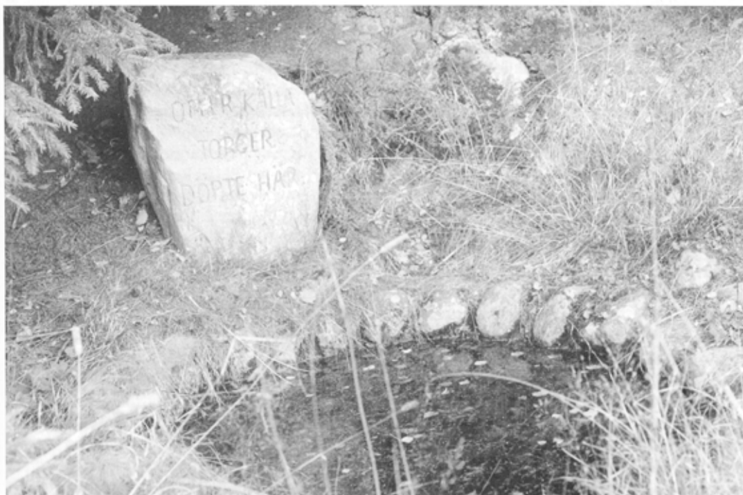
Torgerkilden i Vest-Värmland restaurerades omkring 1930. På mindestenen står: OFFERKÄLLA - TORGER DÖPTE HÄR. (Värmlands län, fornlämning nr. 22)