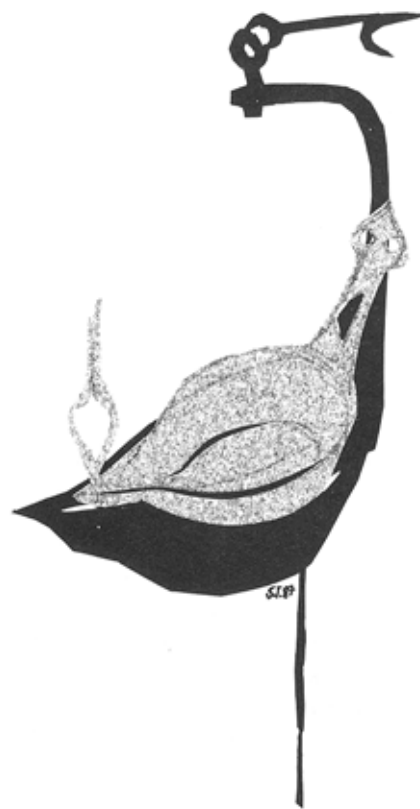
Islandsk olielampe med indstillelig vægeskål.

Undervejs fra England til Sverige, hvortil