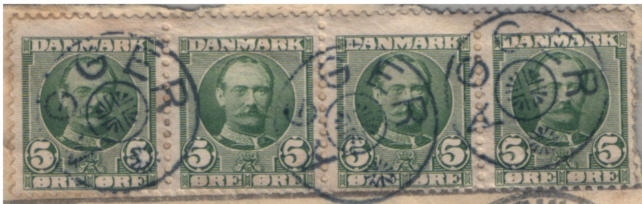
Aggers stjernestempel som har været flittigt brugt.