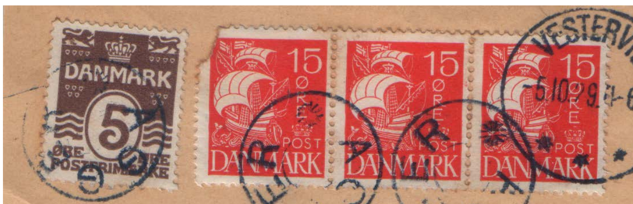
Her er tidligste kendte dato, hvor det udslebne stjernestempel var i brug.