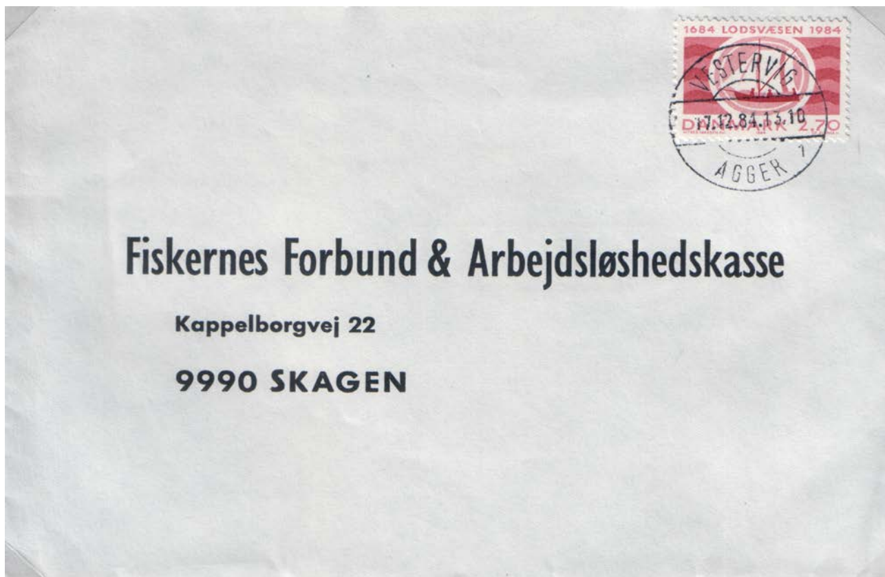
Aggers sidste stempel – her anvendt 1984.