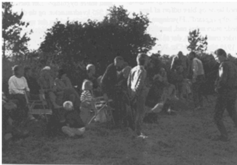
Kjelstrupbeboere samlet til Sct. Hansbål på Kjelstrup fælled.