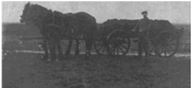
Der køres møg ud i stivvogn med et par stærke heste for. Først lægges det i dynger på marken, før det spredes ud med håndkraft for senere at pløjes ned. Alt foregik med heste- og håndkraft.