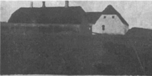
Kjelstrup fattiggård, senere omdøbt til "Stenager"