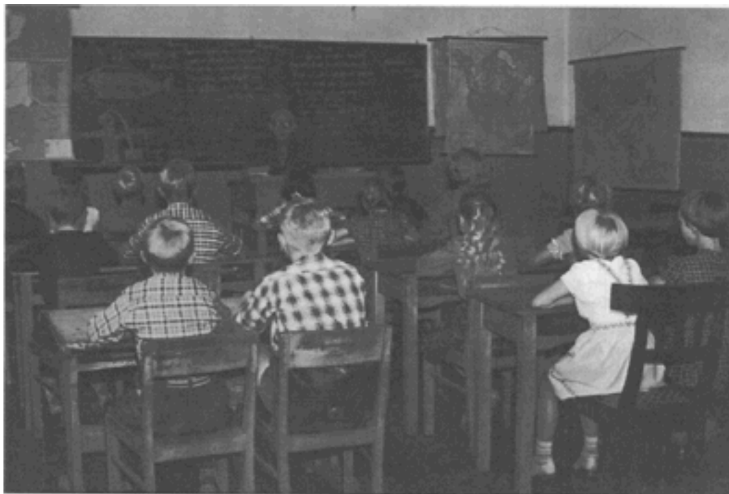
Billede fra klasseværelset i Kjelstrup gamle skole. Lærer Poulsen ved katederet

Det vil sige, at hele huset blev brugt til fest for det lille samfund, og det var uden vederlag af nogen slags.