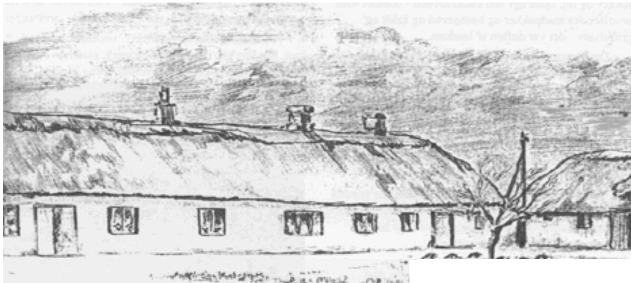
Blyantstegning af Tovsgaard 1945 af Hans Bruun Bertelsen.

Jeg er født i 1931 på Tovsgård i Skinnerup.