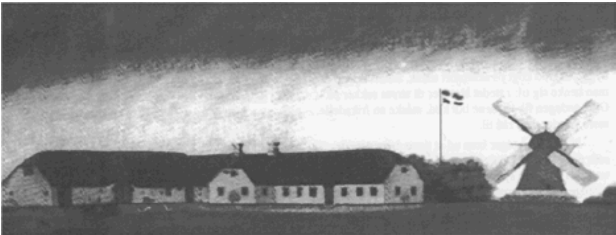
Maleri af Den gamle Brund mølle

I en tid, hvor vindmøller skyder op overalt, kunne det måske se ud som om historien er ved at gentage sig.