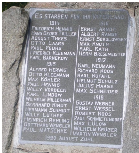
Krigsmonumentet i Kasnevitz.

I Thy og Vester Hanherred ligger i alt 13 marinesoldater fra disse tre torpedobåde begravet. I Hellicsø én marinesoldat fra S66; i Lodbjerg én fra A79; i Ørum én fra S66; i Vang én fra S66; i Klitmøller