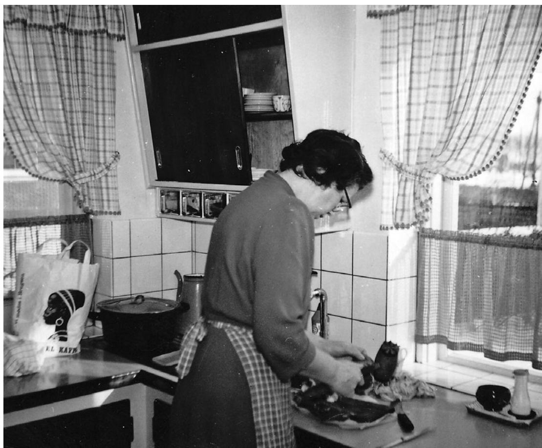
Mosters halvtredserkøkken i den nye lærerbolig. Ternede gardiner, skrå skabe – og brugsens logo på papirsposen.