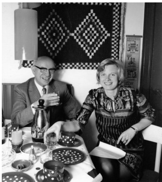
Forfatterens fødselsdag 1974 i hendes hjem, et nedlagt husmandssted på Tandrup Mark i Sydthy.

tage rutebilen hjem til Skyum tog »hjem« til Skjoldborg.