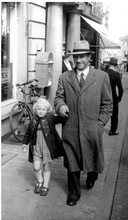
Forfatteren som 4-årig i 1947, i Vestergade i Thisted med onkel Karl. Begge er pænt klædt på til byturen.

Det var kontant afregning på stedet, og så var det glemt. Næsten. »Æ degn« skrev nemlig dagbøger med korte noter. Efter hans død overlod moster mig stakken af dagbøger, og heri læste jeg hist og pist om den og den elev, hvis opførsel han ikke forstod – eller som irriterede ham. Og meget andet fra hverdagslivet i øvrigt. Som førstelærer havde man ikke så mange kolleger at dele sine problemer med. Men så var der jo dagbogen. Og moster.