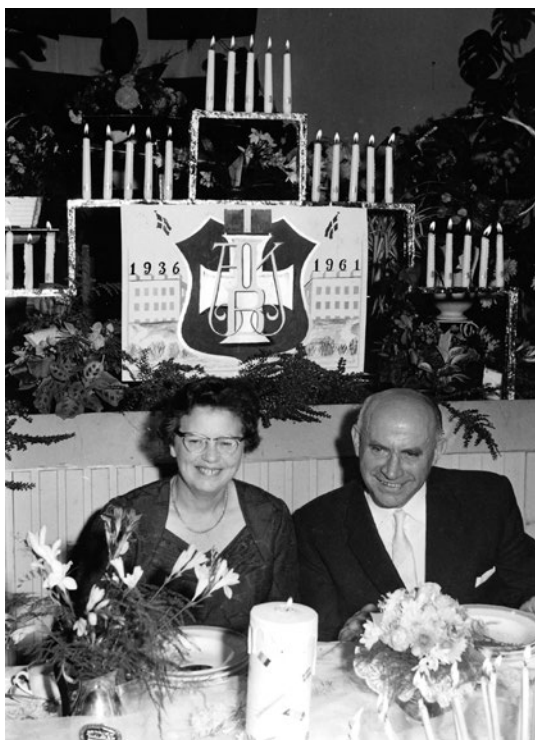
Sølvbryllupsfesten stod i sognegården i november 1961 med levende lys, blomster, sange og taler.

Jeg tror nu alligevel, det trak tænder ud, når der var konfirmation, og de i rækkefølge modtog en stribe invitationer til fester rundt om i de små hjem. De tog imod i den indløbne rækkefølge og fordelte besøgene, så det altid blev til mindst tre konfirmationer – og taler – pr. dag. Frokost, eftermiddagskaffe, middag – og måske aftenkaffen et sidste sted. Sådan! De følgende