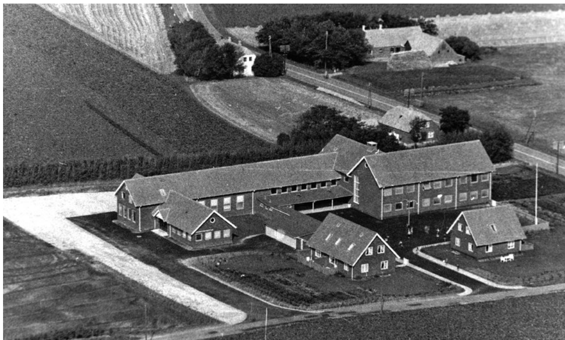
Skjoldborg Skole ca. 1955.

Forskolens klasser omfattede 1. klasse (1. årgang) og 2. klasse (2. og 3. årgang). Al undervisning var fælles for drenge og piger. Hovedskolen omfattede 3. klasse (4. og 5. årgang) og 4. klasse (6. og 7. årgang), med særskilt undervisning for drenge i gymnastik og sløjd (3.-4. kl.) og for piger i gymnastik og håndgerning (3.-4. kl.) samt i skolekøkken (4. kl.). Skolen havde desuden en særklasse for børn, der »af hensyn til evner« ikke kunne følge den almindelige undervisning. Der blev hele året givet 4 timers særundervisning ugentlig. Det anføres desuden, at sognepræsten var »bekendt med og tilfredsstillet af skoleplanens rammer