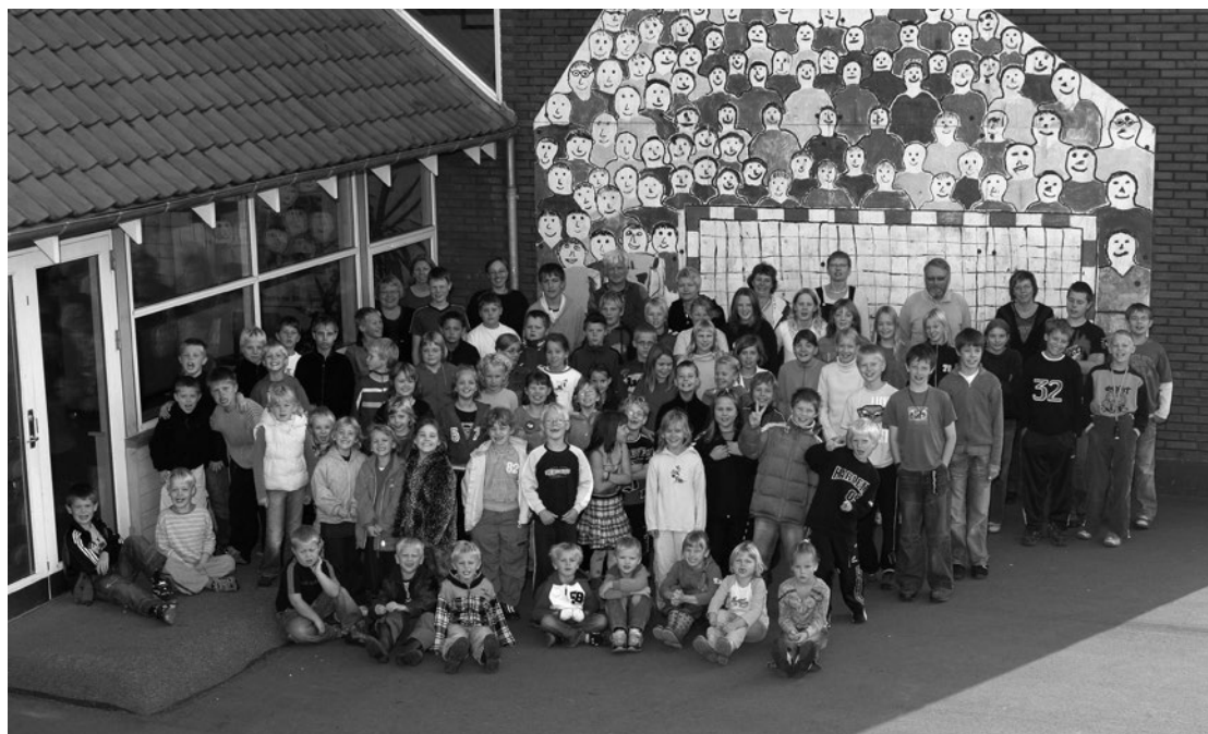
Elever og personale samlet i skolegården ved 50-års jubilæet i 2005.

I 2006, efter veloverståede valg, fortsatte lederne fra de tre skoler sonderingerne omkring et samarbejde. Skjoldborg var på dette tidspunkt villige til at afgive 7. klasse, mens Stagstrup umiddelbart var mere skeptiske. Den nyvalgte bestyrelse gav Gylling mandat til at arbejde videre sammen med Snedsted – uden Stagstrup, der valgte at droppe ud. Det førte til følgende forslag for de to skoler: