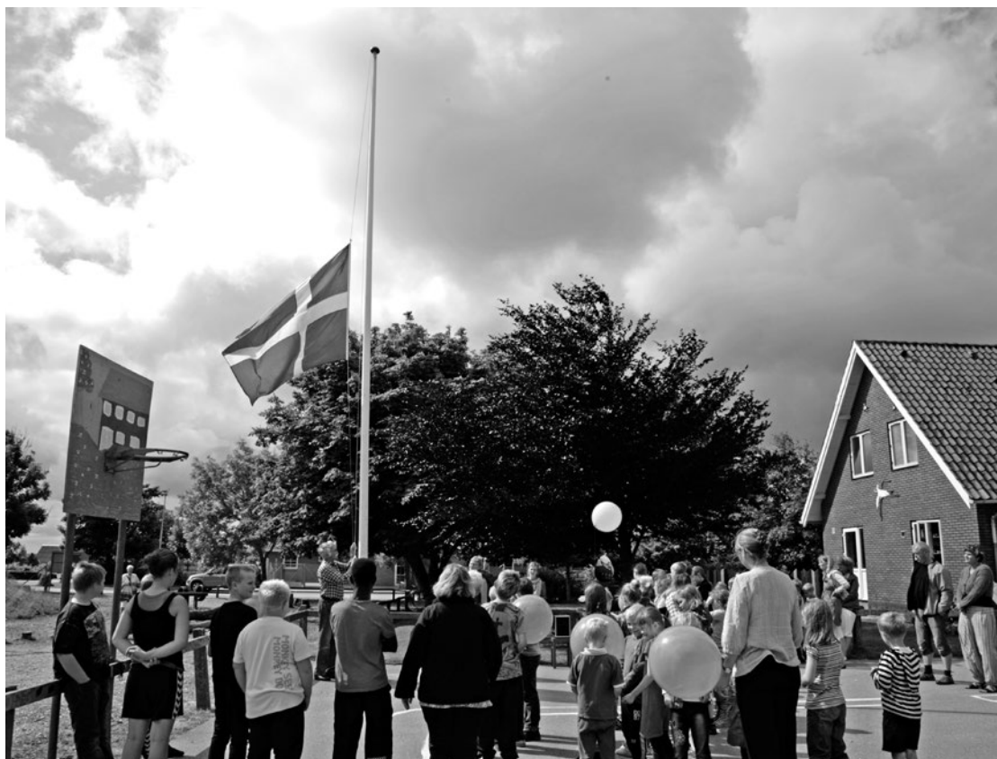
Sidste skoledag.

3. klasses skole ville give mulighed for en sådan. I sidste ende trak byrådet så meget i land, at Skjoldborg fik lov til at fortsætte, fra 2007 som undervisningssted op til 5. klasse under Snedsted. Idéen om en landsbyordning var dog ikke død.