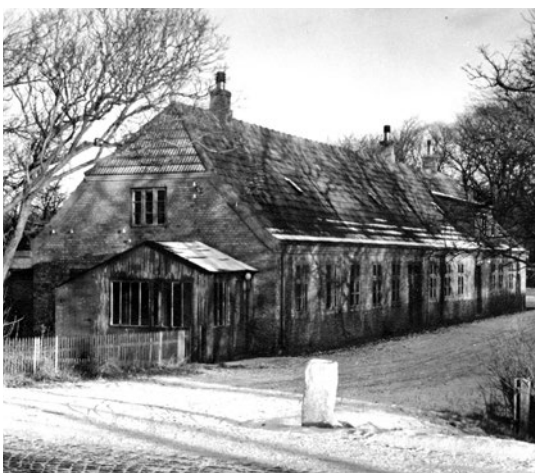
Den gamle skole i Skjoldborg.

Den sidste Skjoldborg Skole, der blev indviet i 1955 og altså lukkede i 2011, opstod således i forbindelse med én landsdækkende strukturreform og blev nedlagt som følge af en anden.