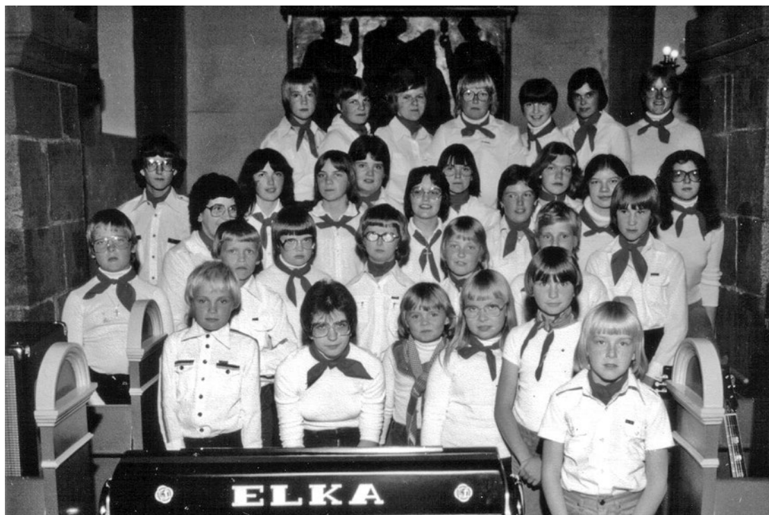
Skjoldborgkoret, én af kulturcentrets mange udløbere.

I efteråret 1989 kom skolelukninger igen på