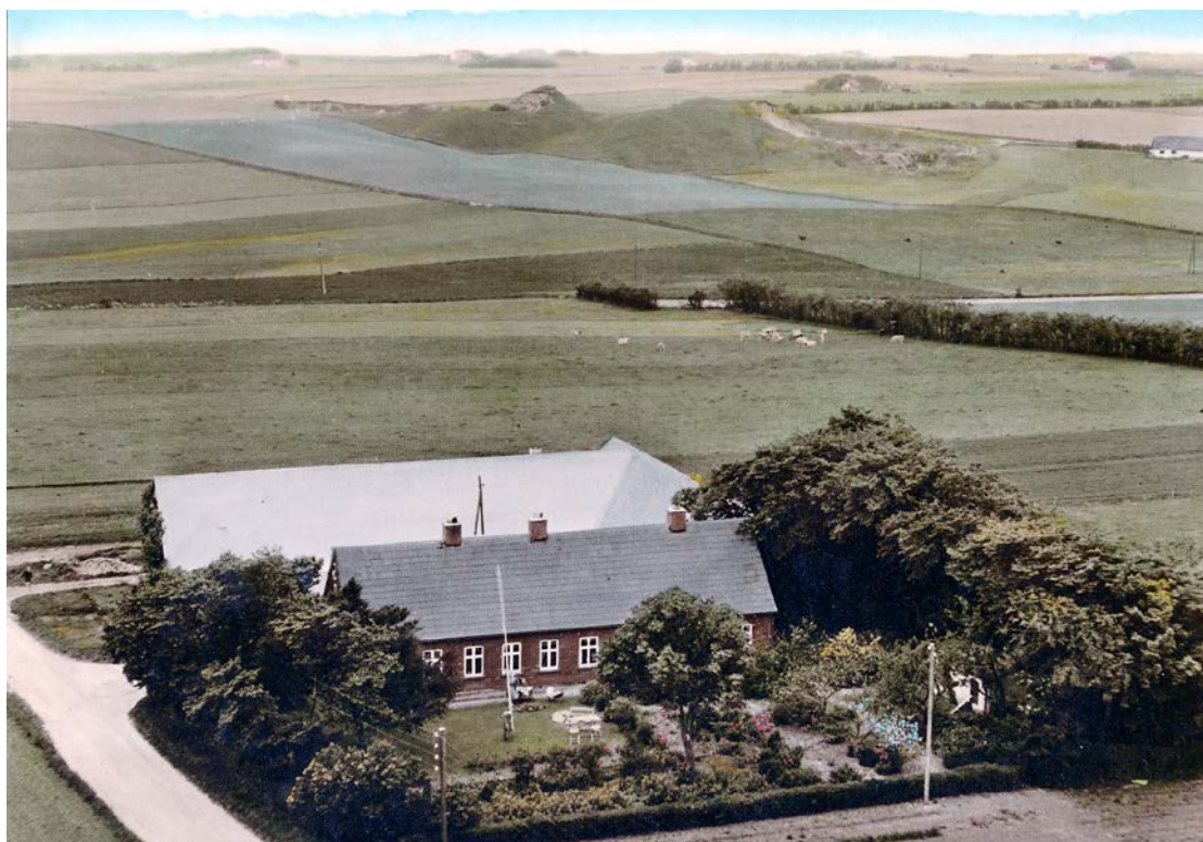
»Vadestedet« i begyndelsen af 1950'erne med Hejrhøj i baggrunden.