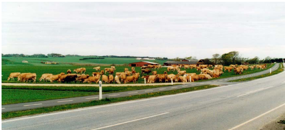
Jerseykøerne dominerede i mange år billedet af »Vadestedet«. Her 2002.