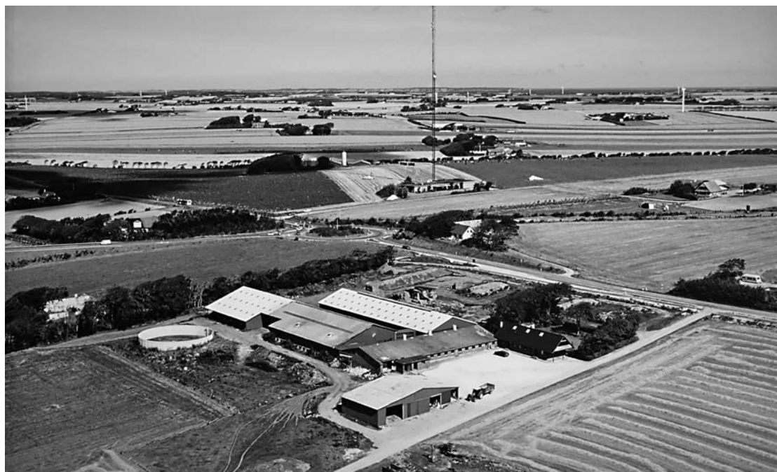
»Vadestedet« omkring 2002.

Først var »vadestedet« kun en betegnelse for selve det sted, hvor man kunne komme over åen. Men da en fæstegård blev flyttet ud fra Tingstrup til området, fik den naturligt nok