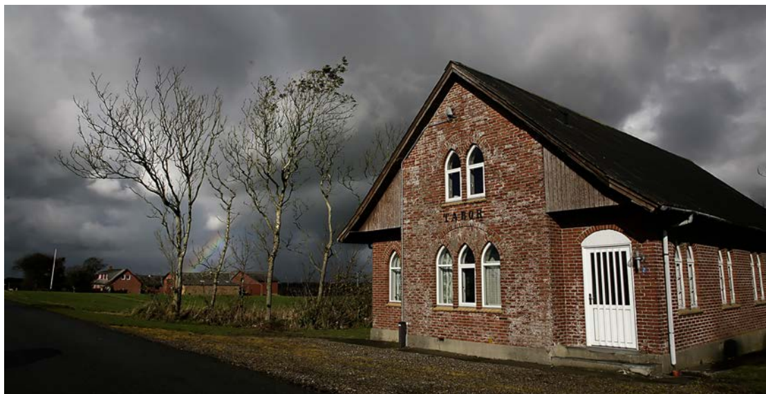
Missionshuset Tabor i Haring.

både praktisk vedligeholdelsesarbejde, indsamling af genstande og indsamling af fortællinger om IMs arbejde og aktiviteter.