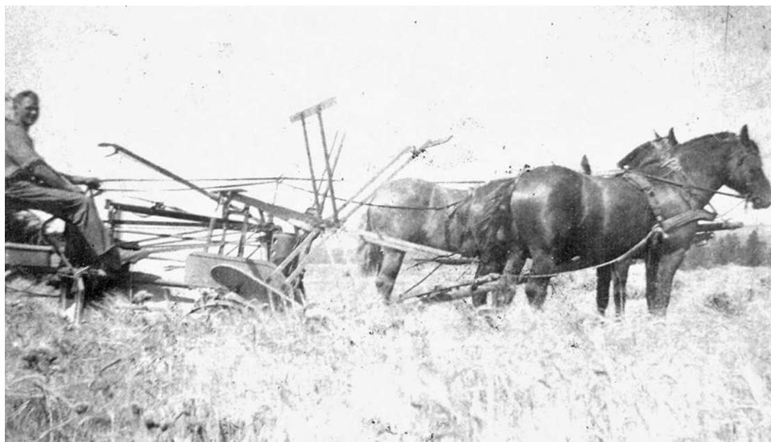
Tjenestekarlen ved selvbinderen er fra familiealbummet. Årstal og sted ikke oplyst.