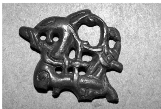
Dette fragment af en urnesfibula af sølv er i 2005 fundet af Claus Thinggaard Larsen, Nørhå. THY3719x29.

De såkaldte urnesfibler må ud fra fundhyppigheden at dømme have været populære; især i egnene omkring Limfjorden er der fundet mange eksemplarer, også i Thy. Smykkerne, der kan være af sølv eller bronze, er udført i gennembrudt arbejde og udformet som et slangelignende dyr med to forben og bagkrop/hale, der slynger sig om dyrets krop. Dette dyr er omgivet af dyreslyng, der enten har udspring i dyret selv eller udgør selvstændige tynde, slangelignende dyr. Dyret og slyngtrådene symboliserer kampen mellem det gode og det onde – løven i kamp med