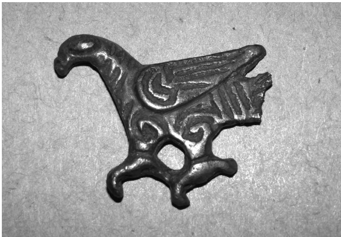
Den lille fugleformede fibula af sølv er i 2005 fundet af Oluf Skadhauge, Frøstrup. THY3719x38.

fiblen have drevet jagt med rovfugle, og smykket kan i så fald have fungeret som amulet for vellykket jagt, eller det har vist bærerens status som falkonér. Sådan har man tolket fund af lignende fugleformede fibler fra Vendsyssel (Nielsson 1997-1998, Olesen 1994).