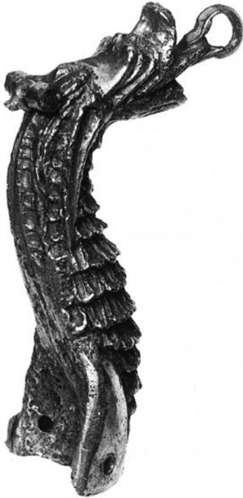
Dragefigur fra Viborg Stiftsmuseum, slutningen af 1100-tallet

Der er ikke belæg for at påstå, at dragen fra Vestervig har siddet på Sankt Thøgers skrin,