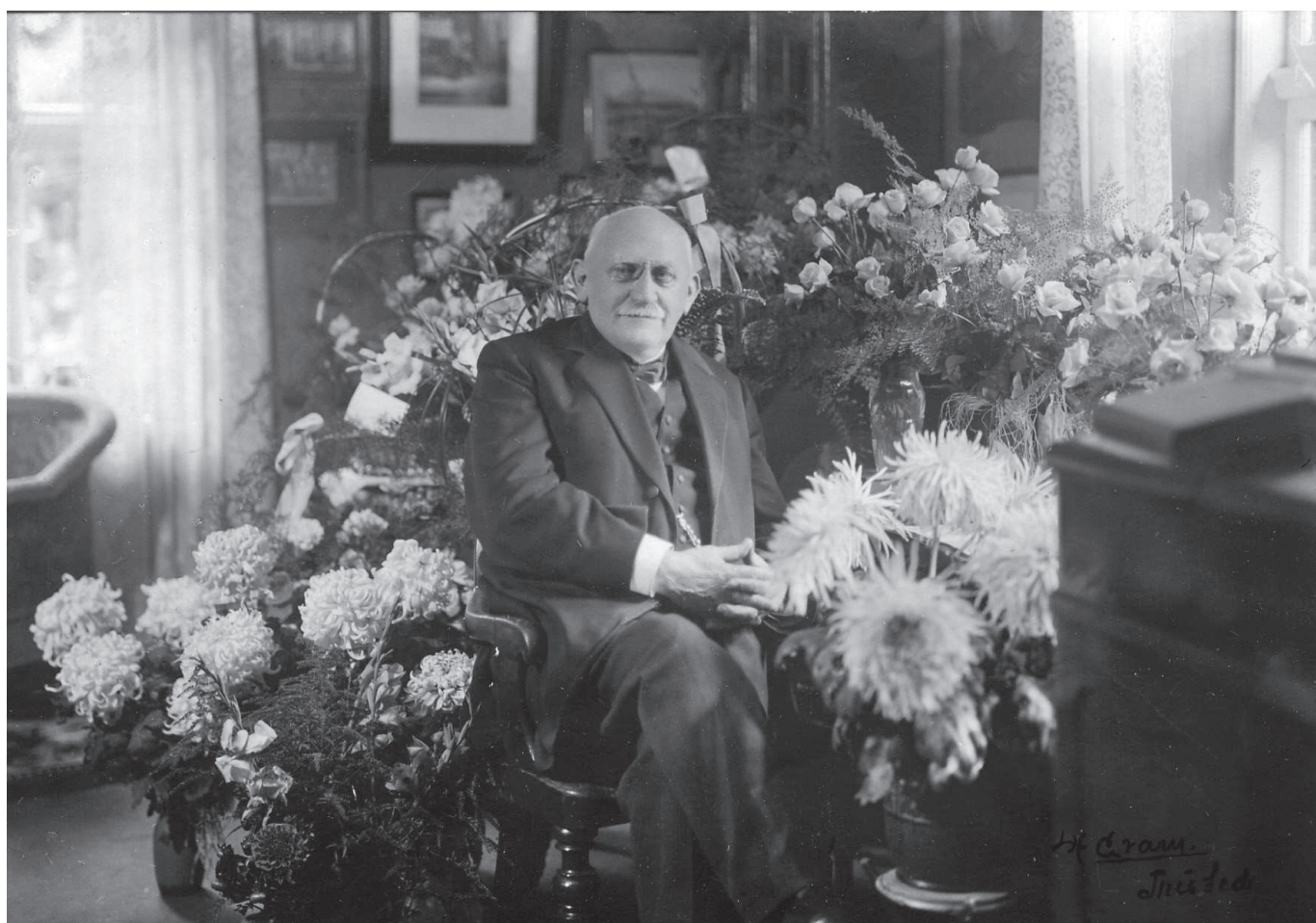
70-årsdagen, den 4. september 1932.

Da provsten den 4. september 1932 fyldte 70, måtte han som alle embedsmænd tage sin afsked. Afskedsfesten blev holdt i Hotel Aalborgs store sal, den nuværende teatersal. Blandt den lange række af talere var også Per Sunesen, den ene af de tre udsendinge, der i sin tid var draget ned til Helligsø for at se den unge præst an og høre ham prædike. Han havde intet fortrudt.