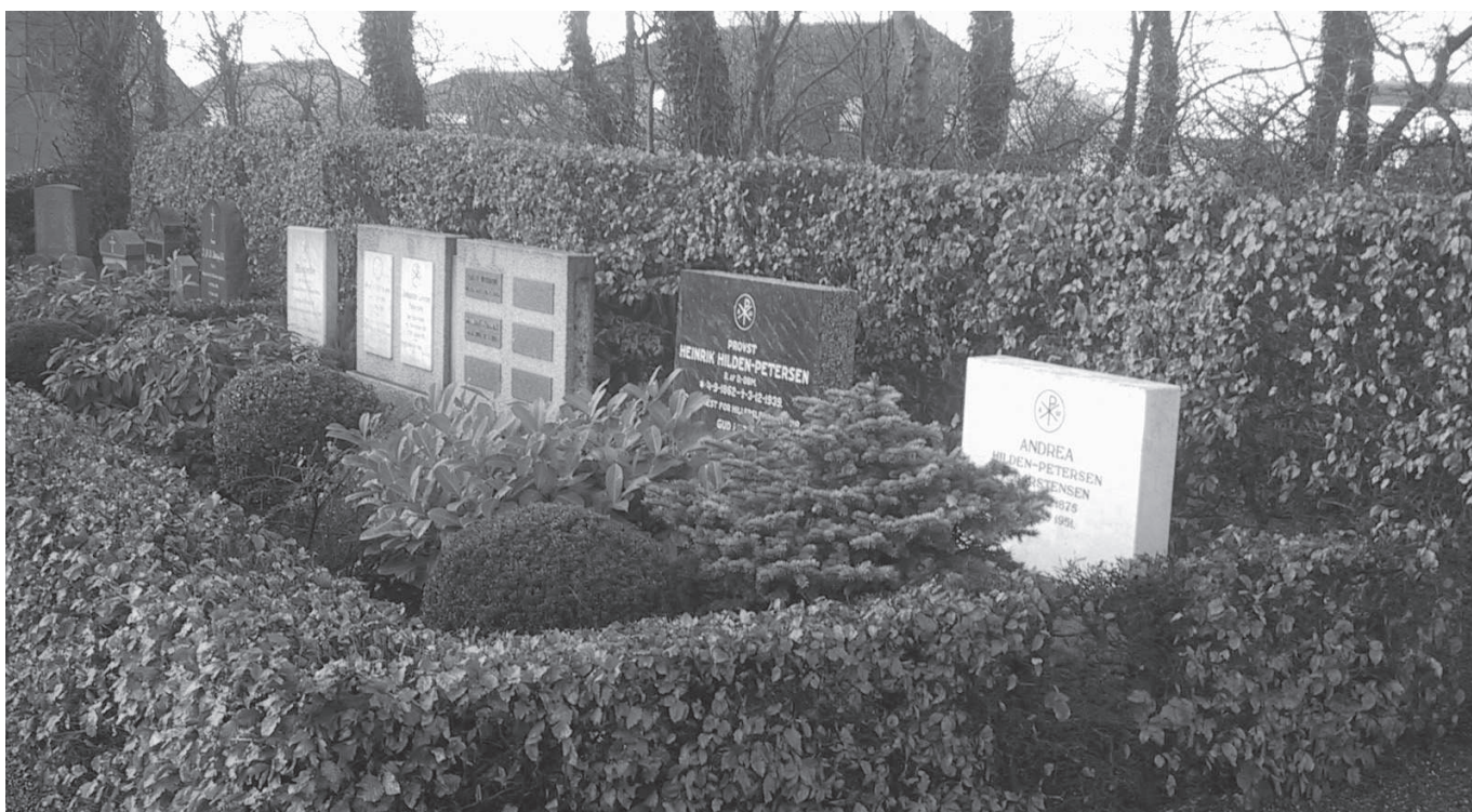
Gravstedet i Hillerslev som det ser ud i dag.