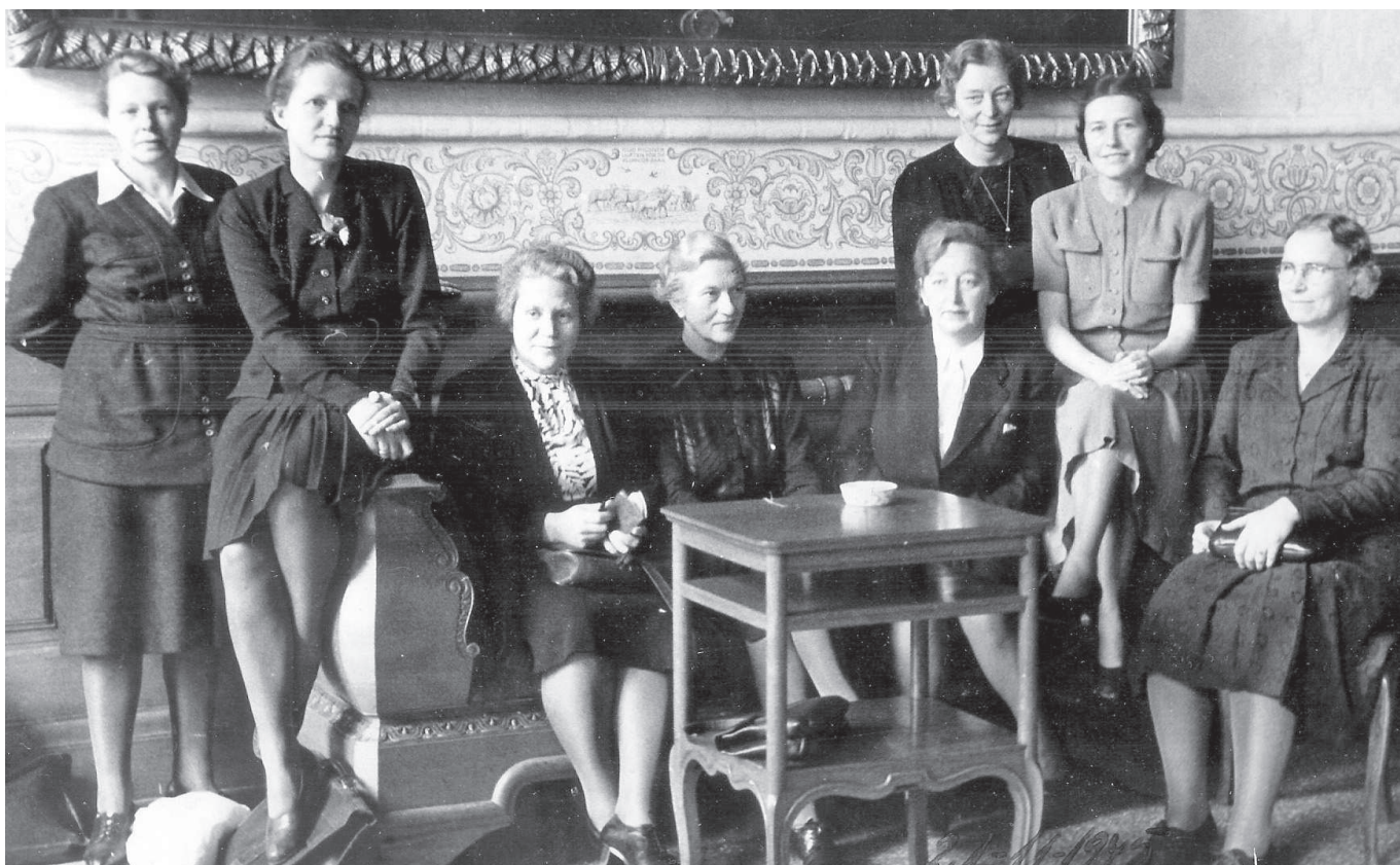
Inger Merete Nordentoft kom i Folketinget 30. oktober 1945 og er her samme år fotograferet med tingets øvrige kvindelige medlemmer. Det er (fra venstre): Petra Petersen (DKP, Kommunisterne), Elin Appel (Venstre), Inger Merete Nordentoft (DKP), Kirsten Gloerfelt-Tarp (De radikale), Ragnhild Andersen (DKP), Erna Sørensen (Konservative), Oda Christensen (Konservative) og Gudrun Hasseriis (Konservative). Folketinget.