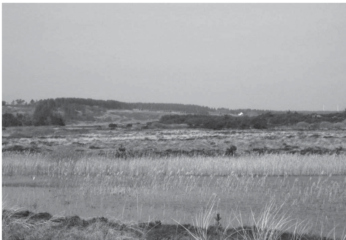
Figur 2. Landskabet omkring Rosholm og Kregpøt som det så ud en lun formiddag i april 2007. Vi befinder os på den såkaldte litorinaflade eller den hævede havbund fra stenalderen. Mod vest hæver bakkeøen Hanstholmen sig med sine, mange steder bratte skrænter. De to husmandssteder, Kregpøt og Rosholm, lå temmelig isoleret her med Vigsø by som nærmeste nabo.