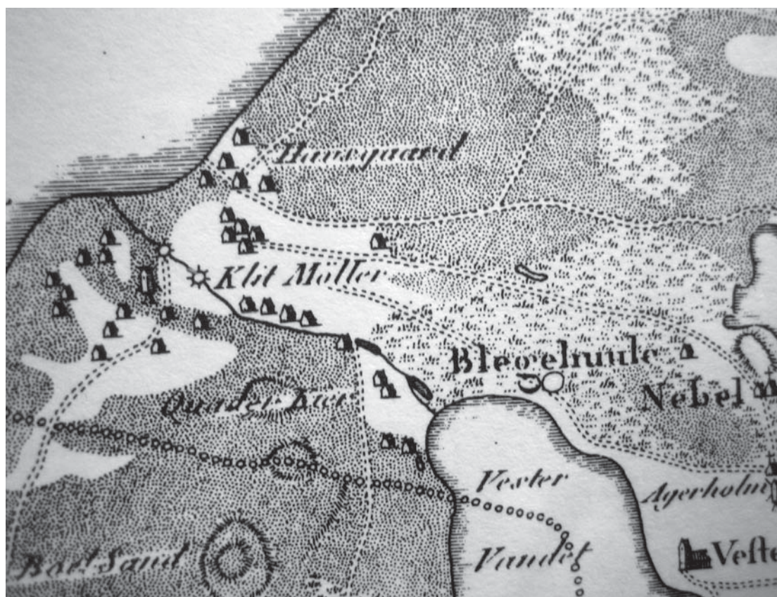
Figur 1. Udsnit af Videnskabernes Selskabs kort tegnet i 1795. Klitmøller i Vester Vandet Sogn var i 16-1700-tallet en relativ stor bebyggelse, der i 1683 bestod af 15 huse og 3 møller. Mod sydøst ses Vester Vandet Sø og sandflugtsmæssigt i læ heraf Vester Vandet by. Værre havde det f.eks. været for Bleghule, Nebel og Agerholm, der alle lå udsatte, specielt ved kraftige bygeagtige nordvestvinde.

F.eks. havde »Huus Manden Pofuel Olufsen Drasbech, En liden Toftt vesten Husit«. Denne lille toft var på ca. ½ tønde land beskrevet som »ond hafrejord, rød Sand gansche under Vand, som i 30 Aar iche har væren oppe, saais [besås] med 1 Kierv [afgrøde] Byg och 1 k. Hafre, hui-ler saa i 16 Aar.« Dette sidste skal forstås som: Hvis den ikke havde ligget under vand osv., da havde det været hensigtsmæssigt at beså den på foreskrevne måde og lade den ligge hen i 16 år. 1 Det skal dog tilføjes, at han yderligere i