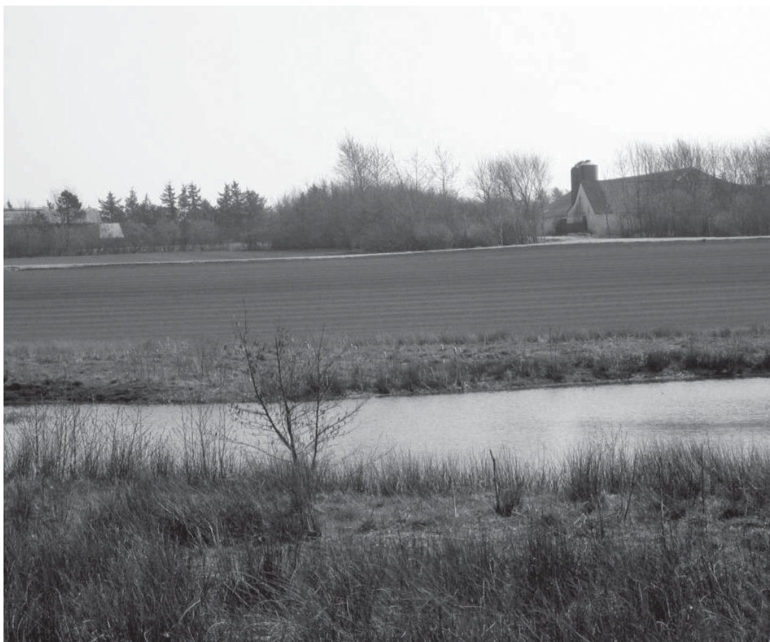
Figur 4. »Vesten Vejen ved Söehuus« var et fald på 3,4 tønder land, hvis 7 agre løb øst-vest og med den vestre del stødende op mod den endnu ikke tilsandede Vorring Sø. På billedet ses den nordlige del af søen med Kjærgård bagerst til højre. Nogenlunde i en linie fra Kjærgaard og mod søen og strækkende sig mod syd (til højre og uden for billedet – se også kortet side 56) må det omtalte sandflugtsskadede fald have ligget.

der ligger åben for sandflugten. Yderligere bliver der oplyst om, at »ved vester ende af dette Fald ligger end nu lidt af Vorring Söe som iche end nu slet er til denet [tildænget] af Sand Flugten«. Af andre sandflugtsskadede fald kan nævnes »Struds Ager Fald«, hvor Kjærgaard havde 6 agre (ca. 1 tøndeland), som beskrives som »ond Jord af huid og graa Sand moxen [næsten] ingen Muld.« Selv om Kjærgaard i kilderne bliver regnet som en enestegård,