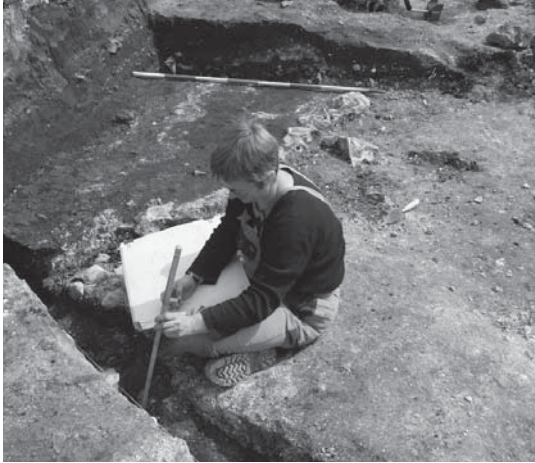
Der arbejdes med registrering af de fremgravede anlæg. Til højre for arkæologen, der sidder på husgulvet, ses rester af tørvevæggen som en mørk stribe.

Det store kridtindhold i Thistedes undergrund bevirker, at der generelt blev fundet mange velbevarede dyreknogler og fiskeben, som var en del af det affald, kulturlagene var bygget op af. En undersøgelse af fiskebenene vil vise, hvad man kunne fange i Limfjorden på den tid.