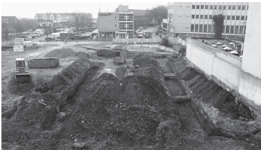
Fra tandlægeklinikken på den anden side af Storegade var der et godt overblik over udgravningsområdet. Midt i billedet ses de to parallelle søgegrøfter.

Blandt fundene fra husene kan nævnes en benskjøjte, en kam og forskellige redskaber lavet af ben, enkelte potteskår, lidt bronzeblik og en mønt, der efter de foreløbige undersøgelser er fra midten af 1200-tallet. I området blev der desuden – med god hjælp af folk fra Thy-Mors Detektorforening – fundet to andre middelaldermønter samt et par mønter fra 1600-tallet.