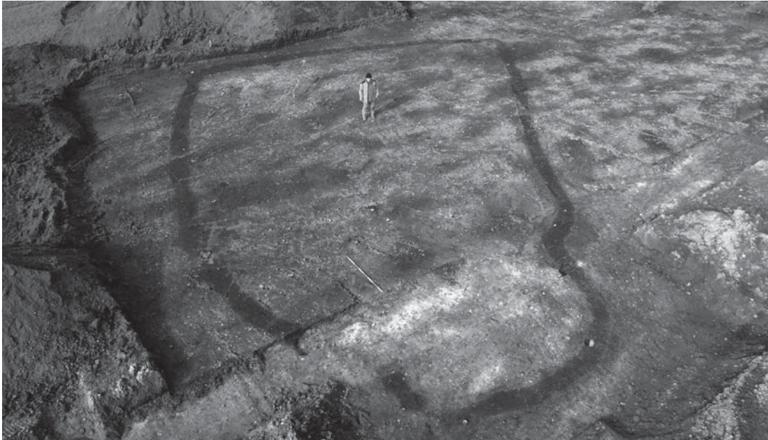
Den formodede dyrefold fotograferet fra lift. Grøften ses som en mørk stribe i den lyse undergrund. Indsnævringen i den ene ende kan være et ekstra indelukke, hvor udvalgte dyr blev samlet.

Lidt syd for huset blev et større område afgrænset af en lav grøft, der tegnede sig som en mørk stribe i undergrunden. Bortset fra et enkelt stolpehul var der ikke andre spor af menneskelig aktivitet, og fænomenet tolkes som en dyrefold, hvilket også kendes fra andre bronzealderboplads i Thy.