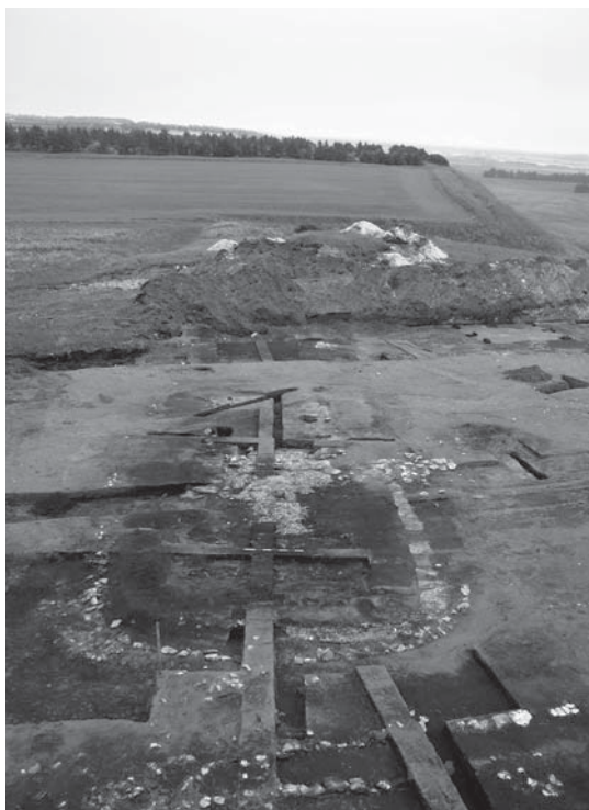
Jernalderbopladsen med et aflanghusene set fra vest. Ved læhegnet i baggrunden blev der fundet jernaldergrave med skeletter under krigen.

andre egne af Thy – bl.a. et nedbrændt hus, der blev undersøgt ved Sdr. Ydby i 2001 og 2005.