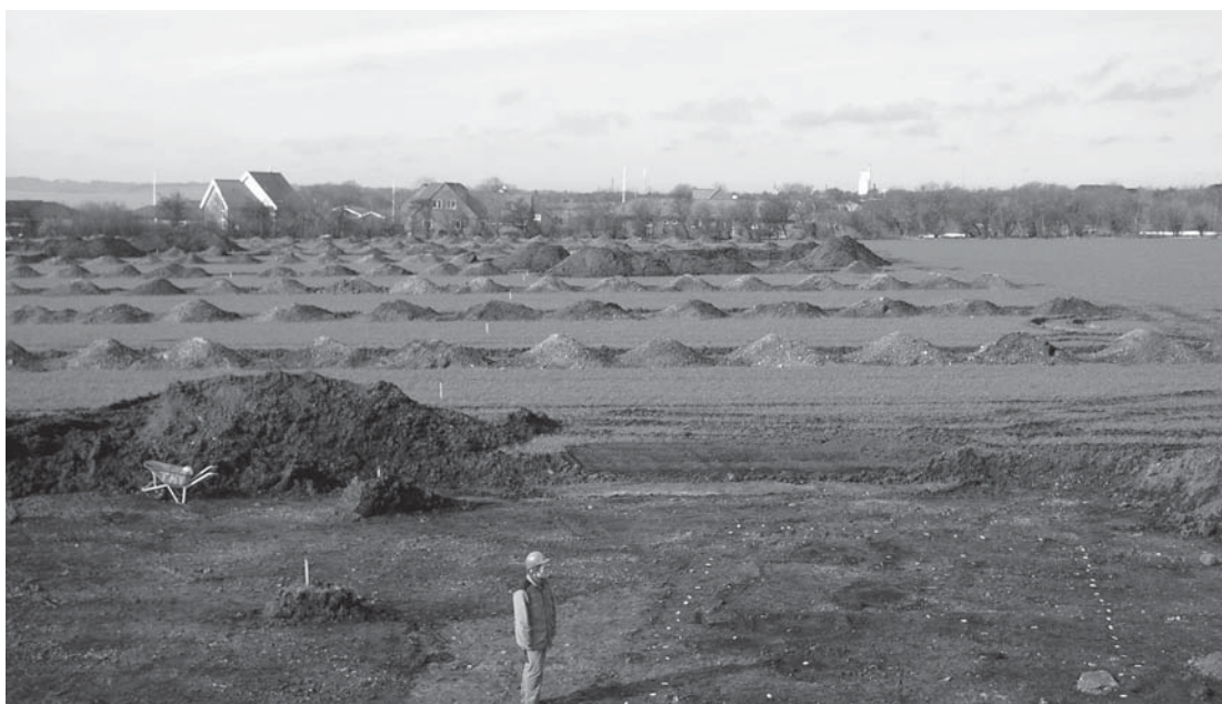
Vestenden af huset lige efter afdækningen, set fra øst. De hvide sedler markerer stolpehuller. I baggrunden, bag de lange søgegrøfter, ses villakvarteret i Thistedes østlige udkant.

Dette års bronzealderhus var dog noget særligt. Efter at det mørke pløjelag var fjernet med gravemaskine, sås i den lyse jord under det mørke muldlag flere steder runde, mørke pletter, der i et enkelt tilfælde kunne følges på en lang række, som perler på en snor. Det var