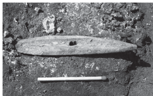
Et lille, spidst knogleredskab med gennemboring. Muligvis en bødenål.

I et af de andre huse lå de sammenfaldne og delvist smeltede forrådskar stadig på gulvet bagved de forkullede rester af én af tagstolperne. Sammen med dem stod to »ildbukke«, lerklodser med gennemboringer, der ofte findes i forbindelse med ildsteder. Det hele gav indtryk af, at der var ryddet op på gulvet og tingene sat af vejen, hvor man ikke kunne falde over dem.