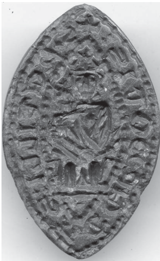
Præsten Ketils segl med en fremstilling af den siddende Jomfru Maria med Jesusbarnet.

Indskriften på seglstampen fra Vestervig lyder : s ketilli sacerdotis d.v.s. segl for præsten Ketil eller Keld. Centralt ses i stiliseret udgave en siddende Maria med Jesusbarnet, hvilket sammen med indskriften og formen på segl-