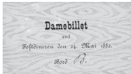
En festdag, et festtog, en festdiner. Der var stil over hele Thy-linjen i 1882.