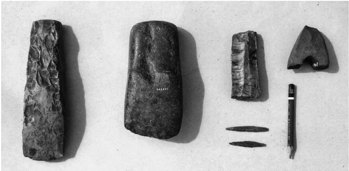
Fire af de fem omtalte fund. Fra venstre ses flintøksen fra kartoffeljorden, skafttapkilen, flækkeblokken og de to pilespidser samt den halve stridsøkse.

Og når der skulle slås et søm i væggen, var den også tjenstvilligt inden for rækkevidde. I dag fører øksen en mere beskyttet tilværelse.