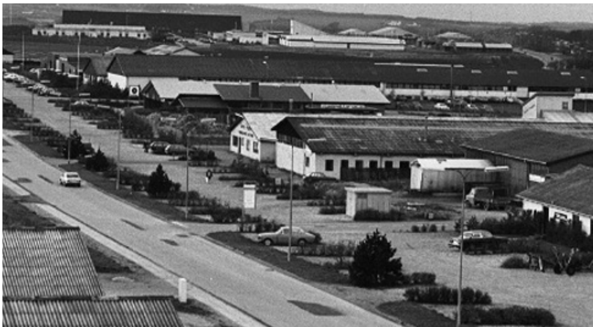
Thisted's første planlagte industrikvarter ved Ringvejen i 1970'erne. Med det nye uddannelsescenter i baggrunden.

nyt bysamfund, var der i 2004 24 industrielle virksomheder med 731 ansatte.