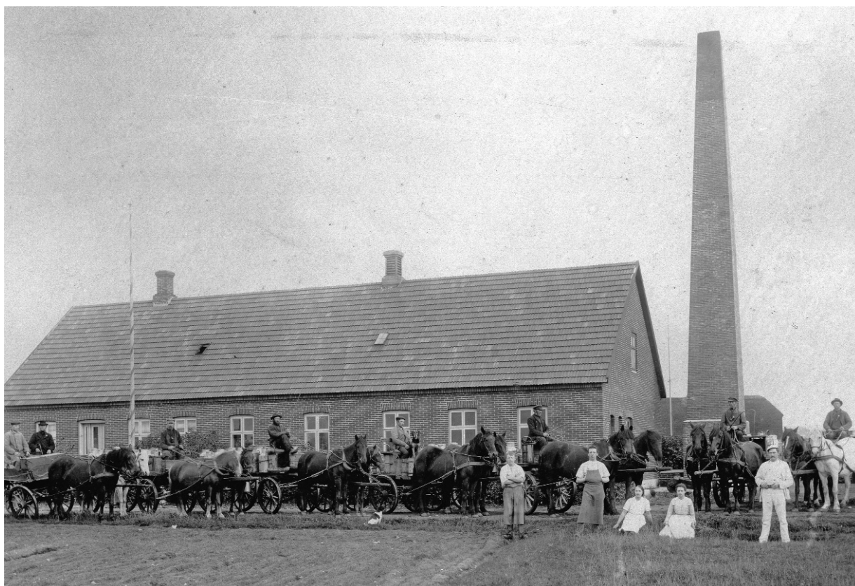
Mejeriet Nordthy, Østerild, med kuske og personale i hvidt.

Ud over mejerierne voksede der forskellige industrivirksomheder op i de nye stations-