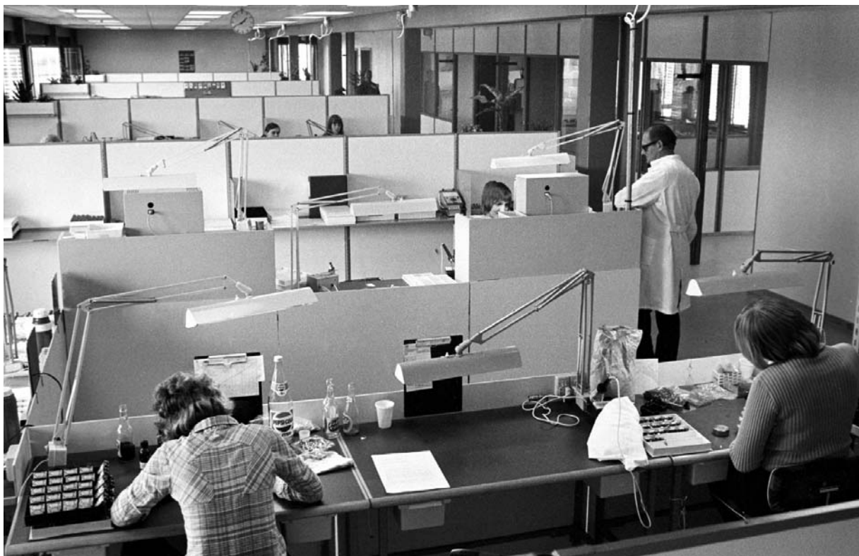
Oticons nye fabrik i Tilsted, 1973.

Thisted Kommune fra 12.000 til 15.000. En del var mænd, der tidligere havde været selv-erhvervende, men en betydelig del var kvinder, der hermed kom på arbejdsmarkedet for første gang. Og blev der.