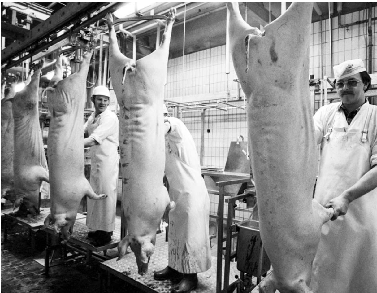
Fra slagteriet i Thisted

Den industrielle revolution var ikke begrænset til Thisted. I Sydthy Kommune steg antallet af virksomheder fra 11-22 med 1245 ansatte og i Hanstholm, der i 1970 var et helt