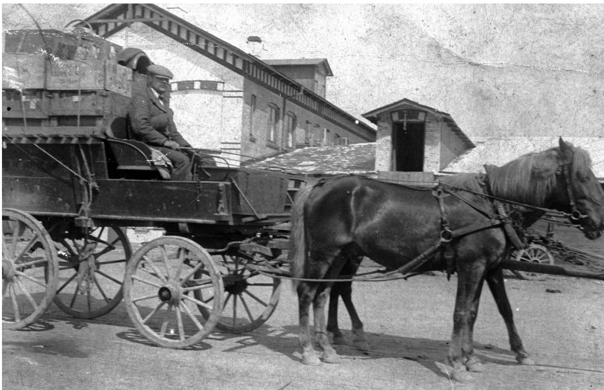
Koopmanns svineslagteri i Thisted. Administrationsbygningen.

G. Undén grundlagde i 1881 et uldspinderi i lejede lokaler. I 1892 blev det til en selvstændig fabrik, der blev udbygget i flere etaper frem til 1915.