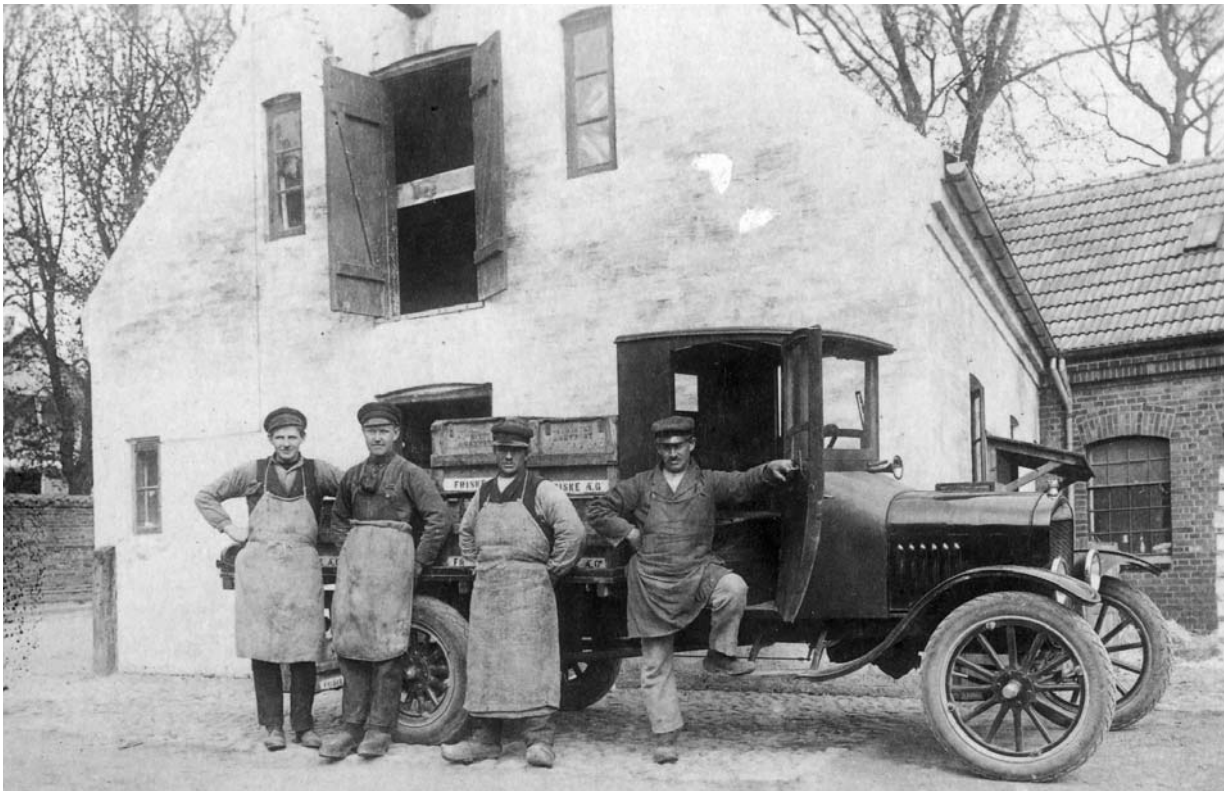
Thisted havde flere bryggerier. Carocksminde Ølbryggeri.