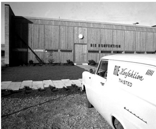
Ries Konfektion. Det førstoptførte kommunale industrihus. Ca. 1965.

80 mio. kr., og der blev skabt 20 nye virksomheder.