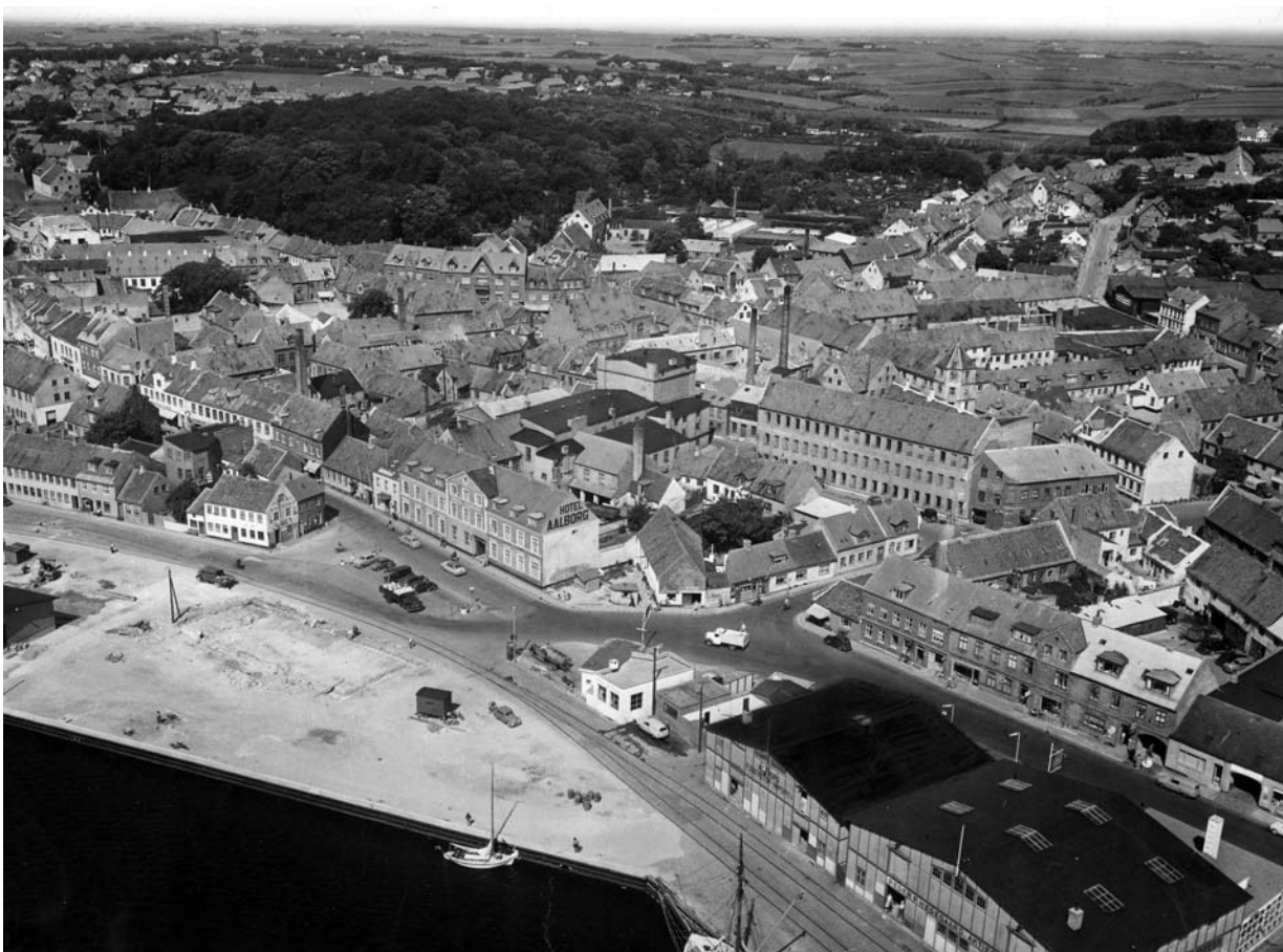
By med industrielle skorstene. I midten uldspinderiet. Luftfoto af Thisted midtby i slutningen af 1950'erne.