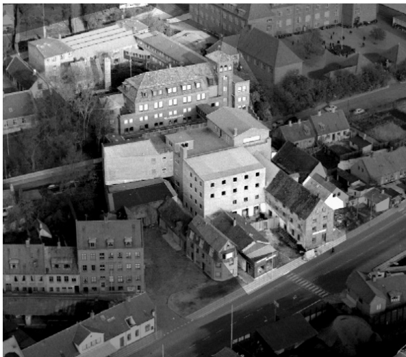
Gammel industrikultur i fugleperspektiv: Havnens kullager, Dampmøllen og Smithson.

mende Thisted Bryghus, Thisted Maltfabrik, Dragsbæk Margarinefabrik og Thisted Andels-Svineslagteri.