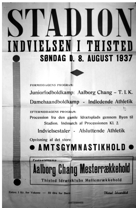
Hvad scrapbogen gemte. Plakaten fra stadion-indvielsen søndag den 8. august 1937.

Hvis det er en idrætsleder, det drejer sig om, kan det vise sig, at scrapbogen slet ikke er en – scrapbog! Det er en samling ud klip i en mappe med påskriften »scraps« – tilsyneladende tilfældige og uden en kronologi – og da man åbner denne mappe, vælter en række »klichéer« ud. Det er de zinkplader, som fotografier tidligere blev ført over på, så de derefter kunne aftrykkes i aviser og bøger.