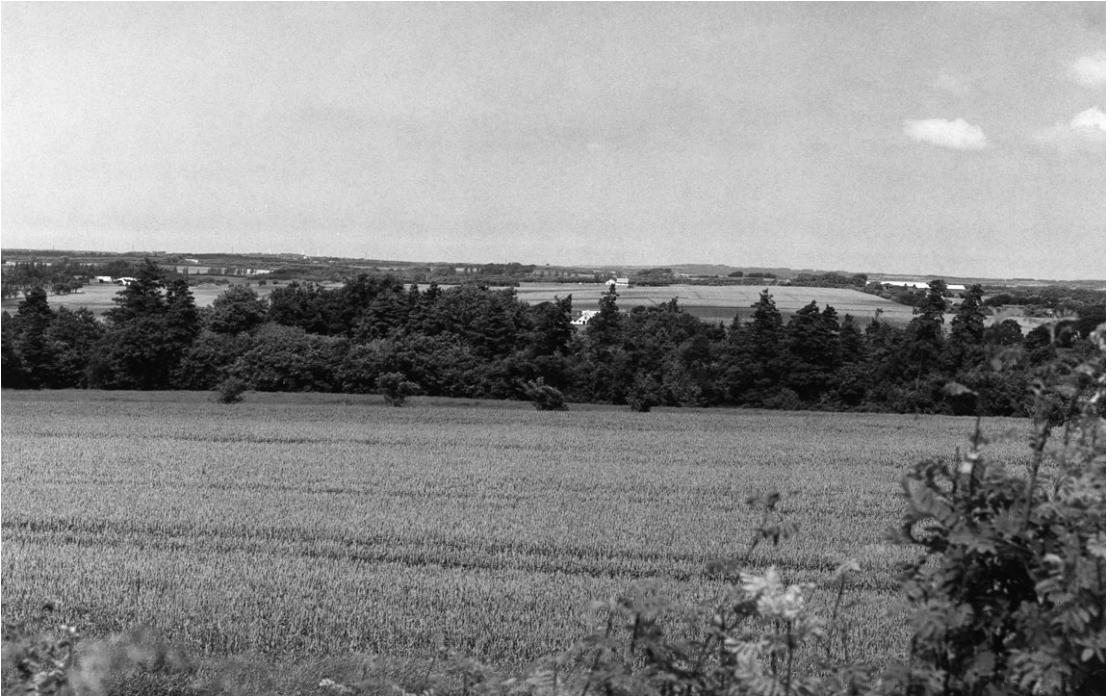
2003. Mod Tømmerby Kirke (nord).