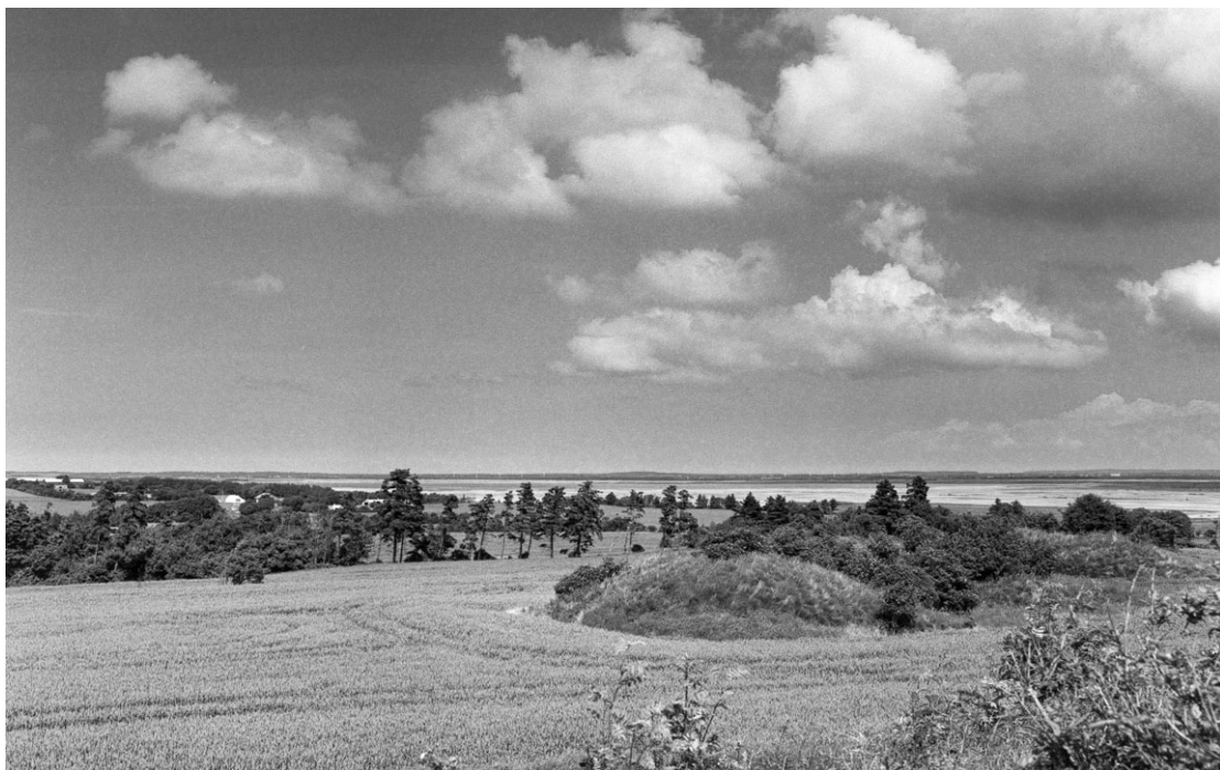
2003. Mod Selbjerg Vejle og Bygholm Vejle (nordøst).