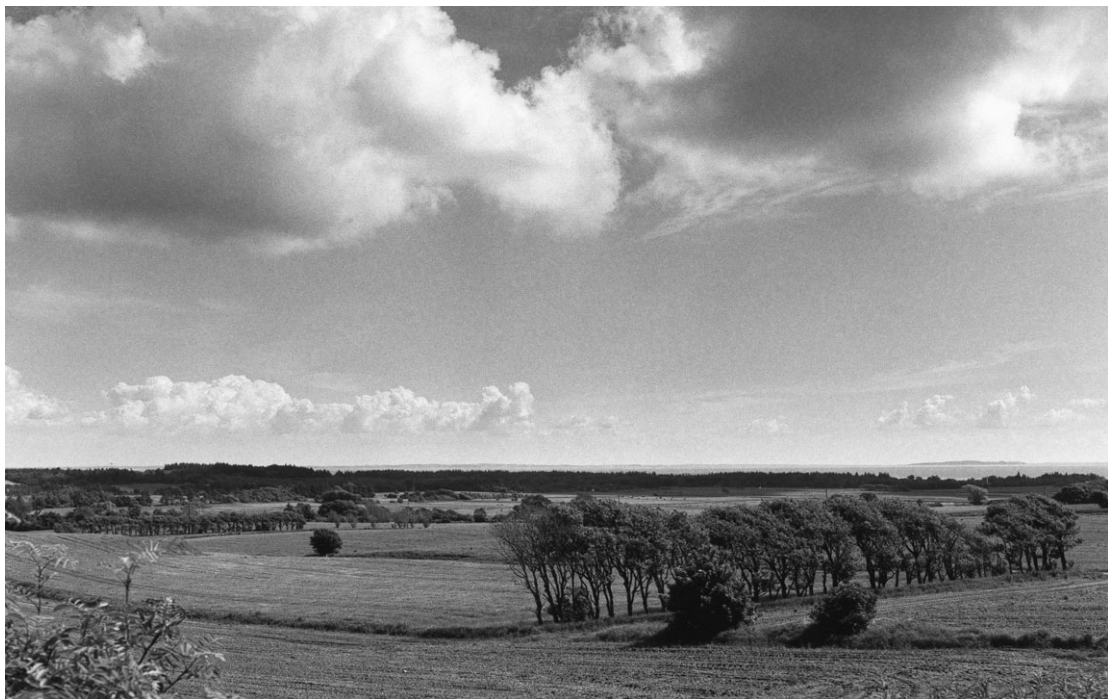
2003. Mod Fur og Livø (sydøst).