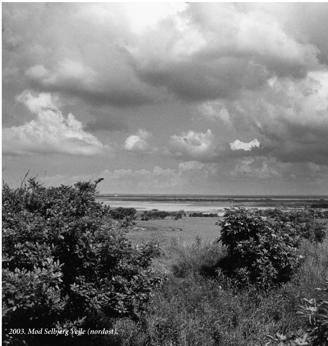
2003. Mod Selbjerg Vejle (nordøst).