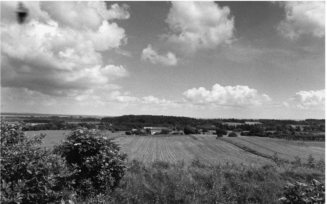
2003. Mod Skårup (øst).