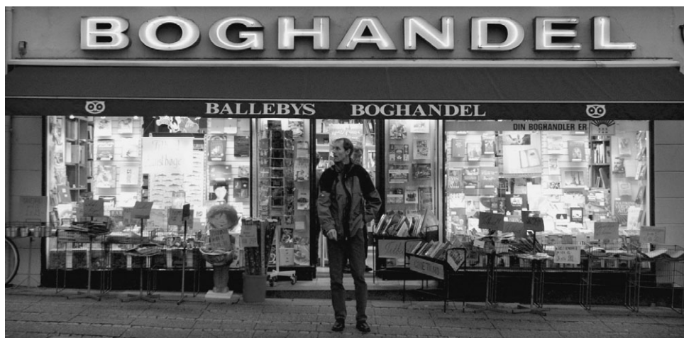
Slutningen af oktober 2001. Endnu er der lys i vinduerne, som er fyldt med bøger. Også i kasserne udenfor er der mulighed for at få et kig i bøgernes forunderlige verden. Men om få dage er det slut...

rindeligt fra Aalestrup, hvor faren var sagfører og familien boede i en ejendom med boghandel i stuen. Det var dengang, det hele begyndte – dét med bøgerne. Han blev udlært i L.-C. Lauritzens Boghandel i Aalborg i 1959 og var senere medhjælper i