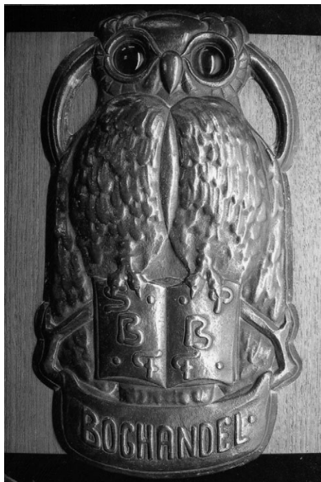
Den kloge ugle i kobber med de lysende øjne. Oprindeligt på døren ud mod Store Torv – senere kastede den sit skarpe blik ud over boghandleren og godtfolk inde i butikken.