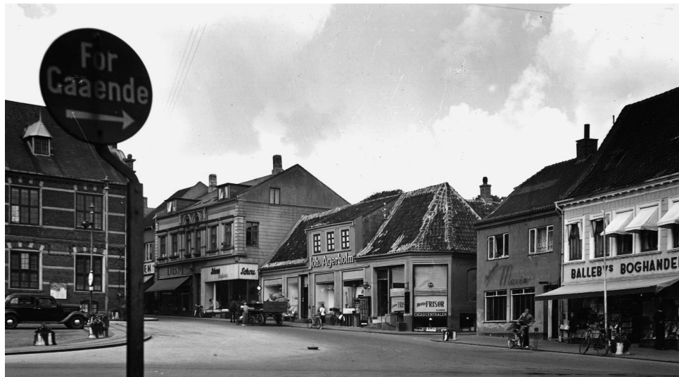
Store Torv anno 1946. Med Ballebys Boghandel, værtshus (Maxim), frisør, isenkrammer (Joh. Agerholm), der senere flyttes ned i Storegade i Valdemar Smiths forretningslokaler. Så er der et Schou-varehus og en tøjforretning (Dansk Beklædnings Magasin). Bortset fra boghandelen skulle der de kommende år ske store ændringer på denne side af Store Torv. Det gamle rådhus til venstre bliver der ikke rørt ved, men bygningen får med tiden nye funktioner.

Jo, alle veje fører til og fra Store Torv, og ofte er anledningen så opsigtsvækkende, at vi alle sammen må møde op på én gang og endda også fylde det øverste af